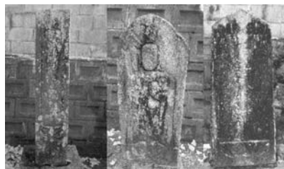
今回、調査をした三基の石造物