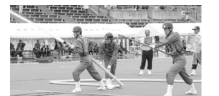
ポンプ車操法で、水を放水する団員