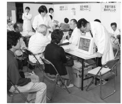
昨年の健康祭の様子

チラシをご覧ください。 【血液さらさら度チェック(要予約)】 受け付け 5月26日(火)、27日(水)午前9時~午後4時