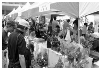
昨年の観光物産展の様子