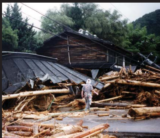
上：上矢作町漆原越沢地区。上村川が増水し家屋を飲み込んだ 下：上矢作町本郷地区弁天橋付近。押し寄せた流木による被害も多かった

2000（平成12）年9月12日、上天作地区を襲った恵南豪雨災害（上部写真）。異常気象が叫ばれている今、豪雨災害の危険性は、ますます高くなってきています。豪雨だけではありません。東海地震は、今後30年の間で87%の確立で発生するといわれています。わたしたちは、過去に起きた災害から何を学び、将来に向けて何をしなければいけないのでしょうか。防災について特集します。