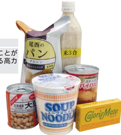
非常食 調理不要で食べることができ、腹持ちのする高カロリーの良いもの。