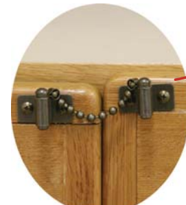
扉の開き防止 地震の揺れによる、扉の開放を防ぎます。食器棚に取り付け、散乱を防ぎます。