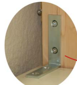
L字金具 家具の背面上部か、背面側部に固定できる箇所がある場合に使用します。