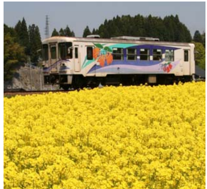
明知鉄道と花畑のきれいな風景

バイオマスファーム「バイオマス活用を推進するために、下水汚泥などを堆肥化後に、土へ還元し、景観作物や資源作物などを栽培する農場の愛称