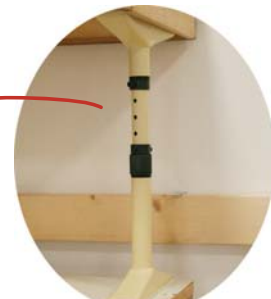
固定ボール 釘やネジを使わずに簡単に固定できます。