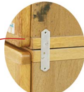
皿金具 上下が分割している家具を固定します。