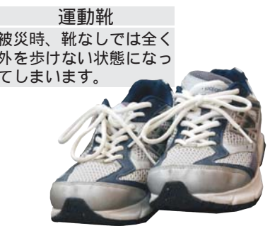
運動靴 被災時、靴なしでは全く外を歩けない状態になってしまいます。