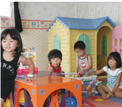
児童センターでは貸し出しもしています