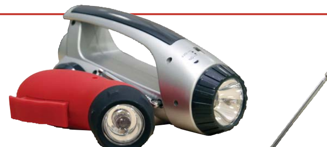
懐中電灯 持ち運びの面からも軽いものが良い。予備電池も忘れずに。

家具を固定できない場合転倒防止に、家具の前下部に敷く板。新聞紙を丸めて使用しても効果はあります。