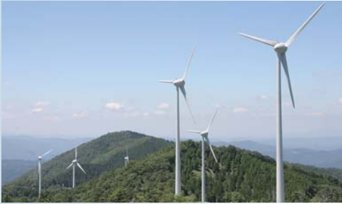
大船山頂に風車が並ぶ