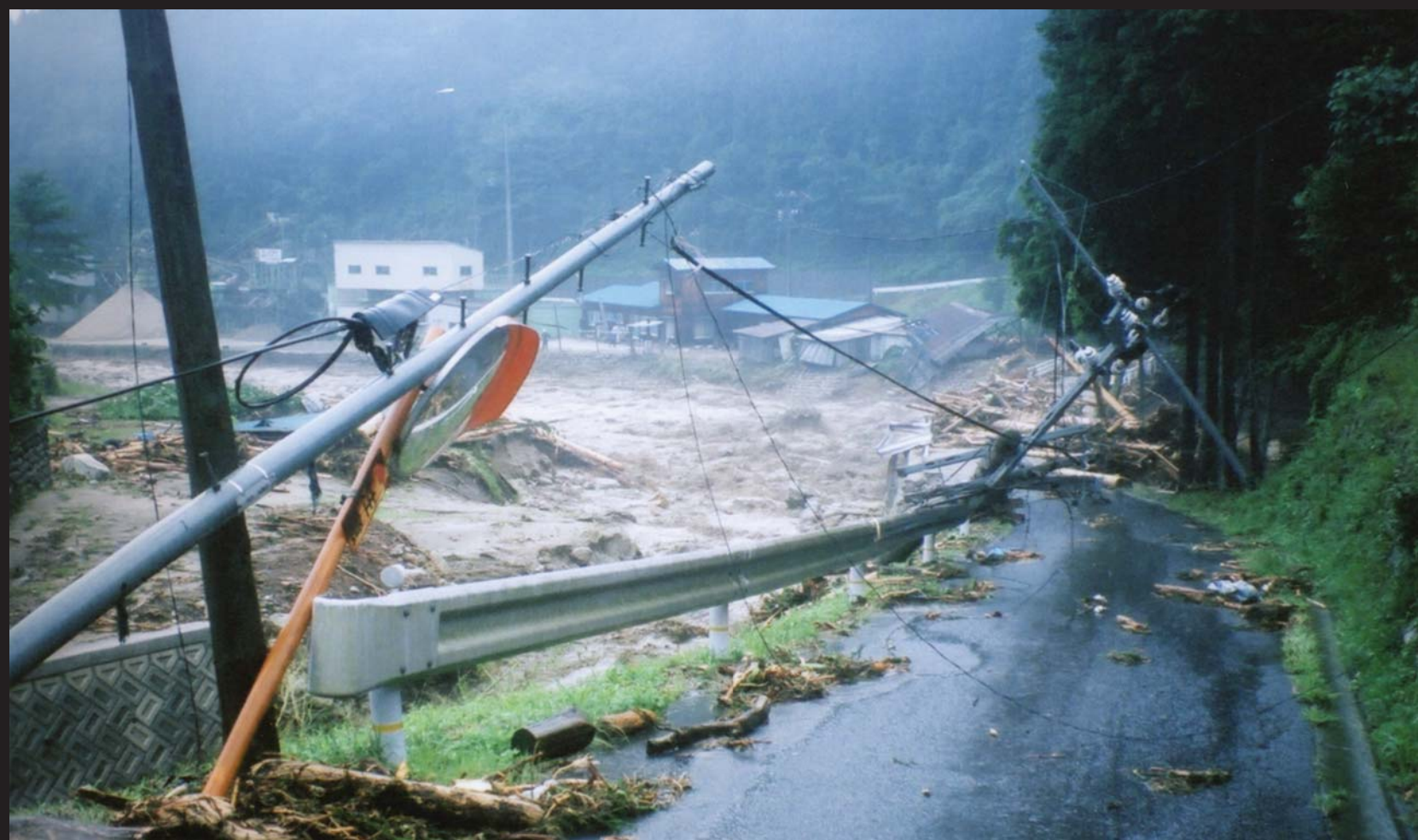
上矢作町飯田洞地区中根橋周辺。飯田洞川がはらんし、橋や道路にせり上がってきた流木