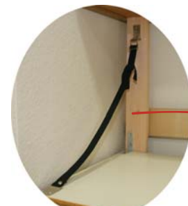
ベルト式耐震金具 家具を固定する箇所が離れている場合に使用します。

家具などは止め金具などで固定しておきましょう。ここでは、主な転倒防止策を紹介します。これ以外にも、転倒防止策はあります。家具や家に合った方法で対策をしてください。