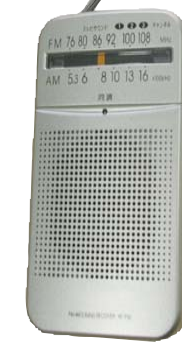
携帯ラジオ 被災時の情報の収集は必要不可欠。予備電池も忘れずに。

各家庭でいざという時のために備える非常持ち出し品。災害時、被災地に救援物資が届くまでの3日間程度を自足し、しのぐための備えとなります。1次持ち出し品、2次持ち出し品のリストを参考に、あなたの家庭に合った物を考え、ぜひ用意しておいてください。