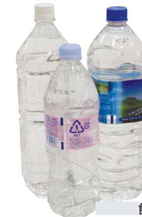
飲料水 ペットボトルの物であれば長期間保存が可能。1人1日3ℓが目安。