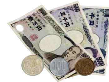
お金 電話は公衆電話しか使えない可能性があるため、小銭を多めに準備しておく。