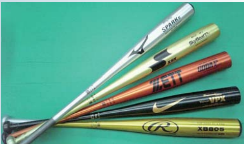
各種の金属バットを生産