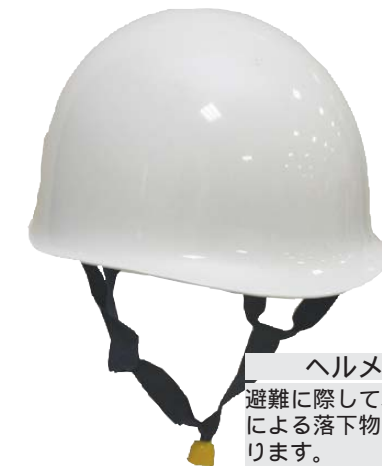
ヘルメット 避難に際して、余震などによる落下物から頭を守ります。