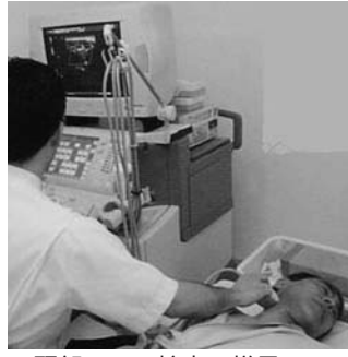
頭部エコー検査の様子

対象 40歳、45歳、50歳、 55歳、60歳(平成21年4月1 日時点の年齢) 対象の方には案内文を送付 します 検診内容 がん検診 胃 がん、肺がん、大腸がん、乳 がん(女性のみ) 一般検査 問診、身体測定、腹囲測定、 尿検査、血液検査(肝機能・ 腎機能・ヘモグロビンA1c・ 脂質・尿酸)、貧血、心電図