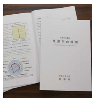
今回で3回目の発刊

本書は、総合計画の31施策と、行財政改革後期行動計画の71項目の取り組みと達成状況、決算状況の分析をとりまとめ、その内容を市民の皆さんにお知らせするものです。詳しい内容については、市