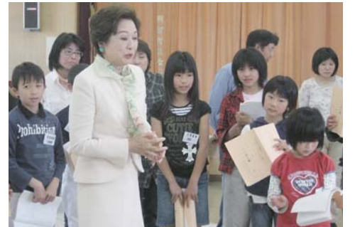
司葉子村長に演技指導を受ける子どもら

入場料 1000円 明智かえてホール は市内の小中学生は無料 販売所 大正村役場、明智振興事務所、恵那文化センター 問 (財)日本大正村 ☎ 543944