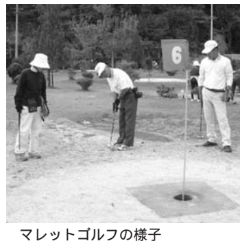
マレットゴルフの様子

健康体力センター講習会(11月) ▷とき=5日(木)・18日(水)午後7時~、12日(木)・25日(水)午前10時~(託児付)▷ところ=まきがね公園体育館健康体力センター▷受講料=520円▷持ち物=屋内用シューズ、運動着、筆記用具▷受講資格=高校生以上(要予約・時間厳守) 託児付きトレーニングDAY(11月) ▷とき=12日(木)、25日(水)午前10時~正午 要予約 プチ講習 ▷とき=6日(金)(ひばりエクササイズ)、13日(金)(ストレッチ体操)、20日(金)(ココから体操)27日(金)(チューブエクササイズ)午前10時~10時半▷ところ=まきがね公園体育館 社会体育施設の貸し出し(11・12月) ▷とき=10月20日(火)(11月分)午後7時~、11月20日(金)(12月分)午後7時~ ▷ところ=まきがね公園体育館 ■・問 まきがね公園体育館(市体育連盟) 25-6478(月曜休館)