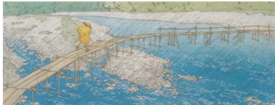
図版 川瀬巴水 仙台評定河原(大正8)夏

広重と巴水は、一般大衆に愛される風景版画家として肩を並べています。歌川広重と「昭和の広重」と称された巴水、二人が描いた日本の美しい風景を、展示します。