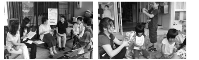
生ごみ減量を行うグループ グループで花植え活動を行う