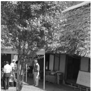
茅葺の家での風景