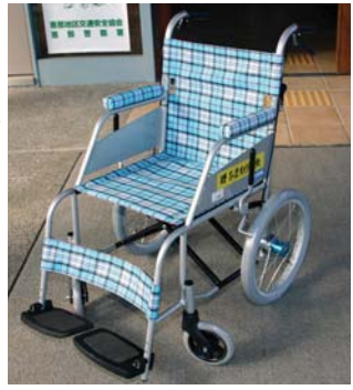
寄贈された車いす

同会は、地域の道路清掃やボランティア活動をしている団体で、空き缶の回収などで資金を作り、今までも、さ