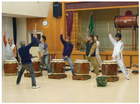
整備した太鼓で練習する皆さん