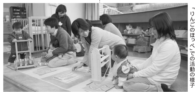
「りんごのほっぺ」での活動の様子

締め切り 12月28日(月) 受託団体の決定 審査会を開催し決定します。 募集要項は、こども元気プラザで配布します 問・問 こども元気プラザ ☎ 25-1155