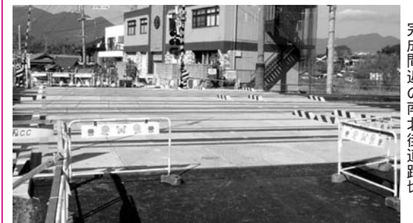
完成間近の南北街道踏切