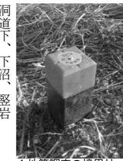
▲地籍調査の境界杭

ハローワーク恵那と社会福祉協議会、市などが協力し、離職により住居を失って困っている方や、雇用保険の受給資格がなく(または受給を終了して)就職活動中で生活費に困っている方に、第二のセーフティネットとして、次の支援を行っています。 □窓口 ▼訓練・生活支援給付ハローワーク恵那 ▼総合支援資金貸付、臨時特例つなぎ資金貸付ハ社会福祉協議会 ▼住宅手当ハ福祉事務所(社会福祉課内) 問 ハローワーク恵那(恵那公共職業安定所) ☎ 26-1211