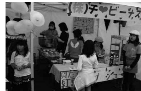
▲小学生が企画運営する店舗