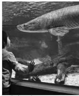
▲南米の魚ピラルクー

世界淡水魚園水族館「アクア・トトぎふ」は、7月14日に、開館8周年を迎えます。日ごろの感謝の気持ちを込めて、7月14日から16日の3日間に限り、小学生以下のお子さん を 無料で招待します。この機会にぜひ、世界最大級の淡水魚水族館アクア・トトぎふへお越しください。 とき 7月14日(出)〜16日(月) 午前9時半〜午後6時(入館は午後5時まで) その他 通常料金は、大人1400円、中高生1100円、小学生750円、3歳以上370円です。 問 世界淡水魚園水族館 ☎ 0586-89-8200