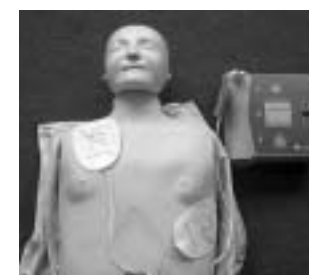
右上が自動体外式除細動器

元気だった人が心疾患などが原因で突然倒れた場合、心室細動や無脈性心室頻拍という不整脈を認める事が多く、心臓の筋肉が不規則にブルブルと震え、全身に血液を送り出す役割を果たせない状態であり、放置すると死に至ります。このような状態を元の正常な状態に戻すには、除細動(電気ショック)を早期に行うことが最も適切な処置なので