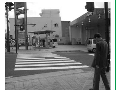
システムが作動する交差点