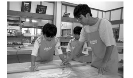
人気のそば打ち体験