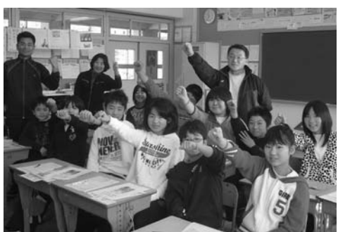
オレンジリングを付けたサポーター(飯地小)

講座では、認知症とは何か、「どういった症状が出るのか」「自分たちにどんなことができるのか」を学びます。職場や学校、友達同士、地域の集まりなど、5人以上のグループで申し込みください。