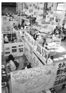
環境フェアの様子

全国モーターポート競走施行者協議会の助成を受けて、11月28日、市民会館で「えな環境フェア2009」を開催しました。