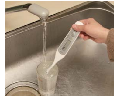
家庭で水道水の残留塩素をチェック

募集人数 大崎配水区 4人 雀子ヶ根配水区 3人 正家配水区 4人 月沢配水区 2人 武並配水区 5人 中野方町 4人 飯地町 5人 岩村町 5人 山岡町 10人 明智町 12人 串原 6人 上矢作町 6人 内容 毎日の水道水の色や濁り、残留塩素の簡便な測定と記録 異常時の通報 そのほか水道に関するモニター 任期 平成22年4月1日(木) 平成23年3月31日(木) 謝礼 月額3,000円 申込期限 3月5日(金)まで に電話で申し込む。応募者が