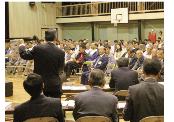
昨年度の地域懇談会の様子(大井小学校体育館)