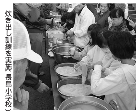
炊き出し訓練を実施(長島小学校)