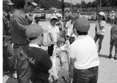
物干し竿と毛布の担架を体験(恵那北小学校)

市では、(財)自治総合センターのコミュニティ助成を活用して、地域防災スクールモデル事業を実施しました。 この事業の財源は、宝くじ受託事業収入です。将来の地域防災の担い手となる人材に對して、防災や消防活動などの知識を得る機会を増やすために、長島町まちづくり委員会は長島小学校・恵那北小学校それぞれと連携して、事業を行いました。 今後は、長島町以外の地域でも、事業を行えるように考えています。 問 まちづくり推進課(内線639)