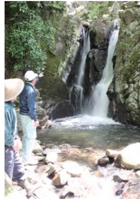
2つに分かれた滝の「釜淵の滝」