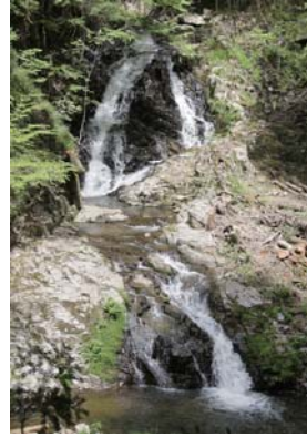
渓谷随一の「元屋敷の滝」