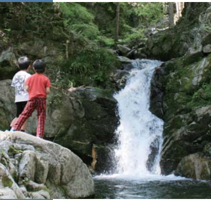
「雨乞い淵の滝」を楽しむ子ども