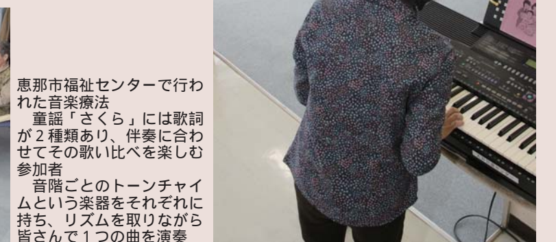
恵那市福祉センターで行われた音楽療法。童謡「さくら」には歌詞が2種類あり、伴奏に合わせてその歌い比べを楽しむ参加者。音階ごとのトーンチャイムという楽器をそれぞれに持ち、リズムを取りながら皆さんで1つの曲を演奏