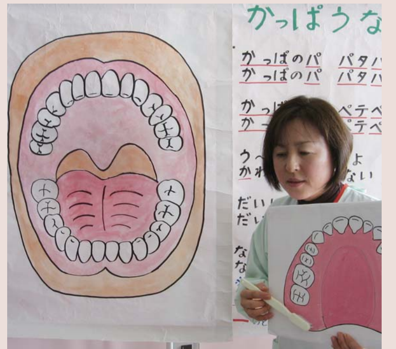
老人クラブやサロンなどでは、口唇、舌、呼吸機能の向上を目的として歯科衛生士から口の体操や入れ歯の手入れを学ぶ

食事や会話をするために いつまでも、おいしく楽しく、そして安全な食生活を送ることは、体の維持には欠かせないこと。その入り口にあるのが、口腔機能です。それは、食べる、飲み込む、話す、表情をつくるといったもの。口は食物を食べるといった機能のみではなく、呼吸や発音、感情表現、免疫、味覚などを担っています。また清潔