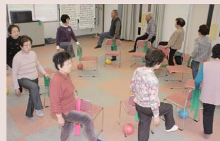
かみやばぎ総合健康福祉センターで行った転倒予防教室 いすを使った足上げ運動は、大腰筋や太ももの前を鍛えてすり足を防ぐ ゴムのチューブの伸縮性を負荷に、胸と肩の筋肉を鍛える