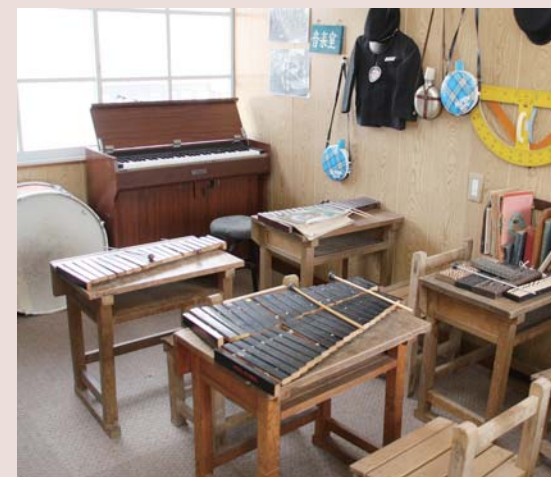
大正時代を思い起こさせる古い町並みがあるという回想法センターが設置されたから草履の奥には懐かしいテレビや扇風機が置いて居間を思わせる昔の小学校の教室や音楽室を思い出すよ

特に「昔、学校で褒められた」「徒競争で1番だった」など、自慢話をするとき、脳の血流が増えます。会話をすることも、相手の話を理解して、どう答えるかを瞬時に判断します。それも脳には、よい刺激となります。 また回想法の活動に参加することは、世代間の伝承する役割が発揮でき、社会参加の機会にも発展できます。それは、要介護や閉じこもりの予防にもつながっていきます。