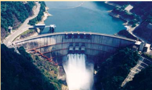
ゲートから水を放水する矢作ダム