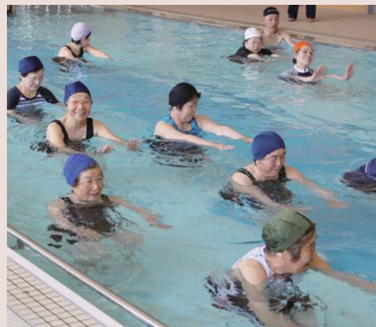
山岡健康増進センターで行った「浮力・抵抗・水圧・水温」という4つの特性を利用した水中運動 プールで行うウォーキングは、水の抵抗によって陸上より負荷のある有酸素運動ができる 後ろ歩きの運動では、浮力によって体重が軽減され、腰やひざなどの関節への負担が軽くなる