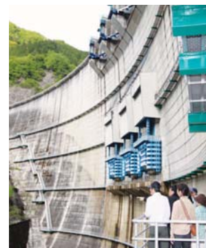
堤体を見上げるダム見学者

毎週火曜日には、一般の方を対象に、ダムの堤体の内部や操作室などを無料で見学できる。年間に約1,200人が見学に訪れ、60m下の通用口から見上げるダムは圧巻。