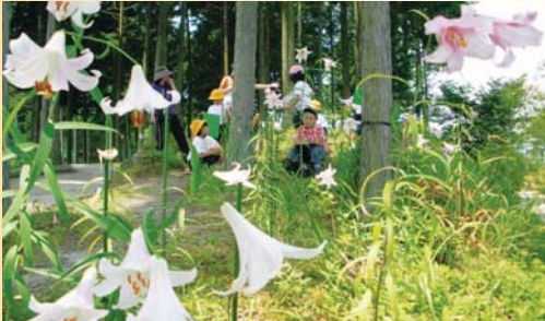
群生地での小学生によるスケッチ風景(串原)