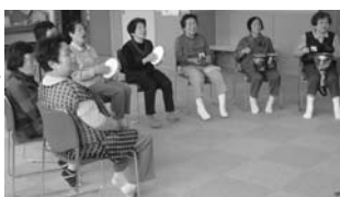
▲楽器や歌を楽しむ参加者たち

を過ごしています。子どものころから青春時代の懐かしい歌や季節の歌を歌ったり、楽器を使って音を奏でたりします。