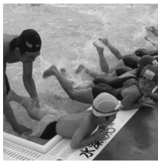
▲泳ぎの基礎を習う受講者たち

(定員10人) 木曜日コース 全4回 第5部 午前9時 9時50分(定員40人) 第6部 午前10時 10時50分(定員40人) 第7部 午前11時 11時50分(定員30人) 第8部(平泳ぎ) 午前11時 11時50分(定員10人)