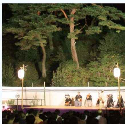
アカマツを背景とした幽玄な新能の世界

とき 8月28日(土) 開場8月28日(土)午後5時半 ところ 岩村城藩主邸跡 演目 能「桜川(半能)」、「黒塚」、「狂言「寝音曲」」 入場料 大人3000円 中・高校生1000円 問 いわむら城址新能実行委員会(まち並みふれあいの館内) 43 4622