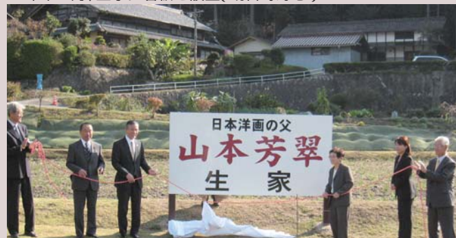
昨年10月、生家に看板を設置(明智町野志)