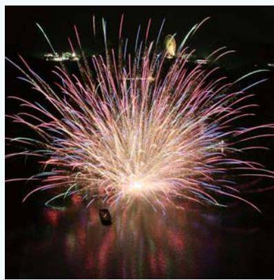
恵那峡の湖面を彩る水上花火

夜空と湖面が彩られる恵那峡の花火は、水上花火と打ち上げ花火の共演が見もの。恵那峡の峡谷に迫力のある音が響きわたります。放生会、灯籠流し、水上花火大会(約2千発)。 とき 7月31日(土) 放生会、灯籠流し 午後7時 水上花火大会 午後8時 ところ 恵那峡さざなみ公園 問 市観光協会 25 4058