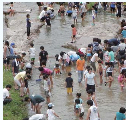
木の実川で魚つかみをする参加者

とき 8月14日(土) 魚つかみ8月14日(土)午後9時 縁日や盆踊り、打ち上げ花火8月14日(土)午後6時 ところ 魚つかみ道の駅ラフォーレ福寿の里裏の木の実川