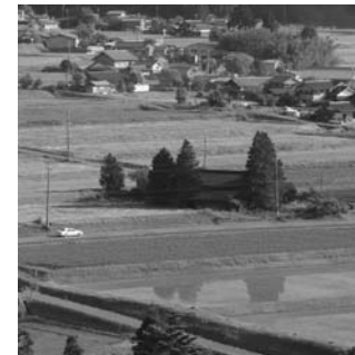
集積している農地

農地の利用促進や集積を進めるために、これまで取り組んできた農地保有合理化事業が、農地法の改正で、農地利用集積円滑化事業に替わりま