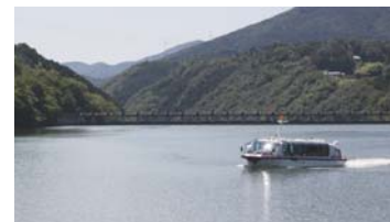
大井ダムの湖上を運航する遊覧船