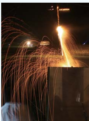
伝統技法のロケット花火

とき 8月16日(月)午後7時 ところ 山岡町久保原爪切地藏前 問 爪切地藏尊奉納花火大会実行委員会(山岡振興事務所内) 56 2111