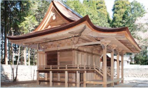
当時の形に復元し、悠久のときを超えた本殿