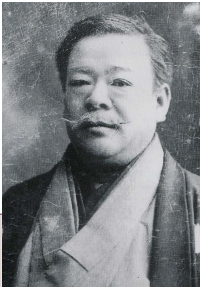
山本芳翠。

1868(明治元年)年、横浜で初めて西洋画を目にし、その衝撃からすぐに西洋画への転向を決意。洋風画家・五姓田芳柳(ごせだほうりゅう)入門し、「芳翠」の号を与えられ、洋画家・山本芳翠として出発しました。その後、山県有朋率いる北海道視察の随行者、第1回勸業博覧会での受賞など、有力な洋画家の一人として成長します。