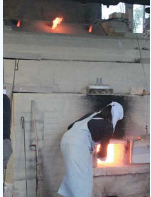
炎を上げる登り窯

初日に火入れ式を行い、3日間昼夜を通して窯焚きを続けます。 とき 7月16日(金)午前7時半 19 ところ 山岡陶業文化センター 問 山岡陶業文化センター 56 4 5 6 7