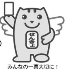
みんなの一票大切に!

問・申 〒509-7292(住所不要)市選挙管理委員会事務局 ☎26-2111(内線550) ☎20-2123 ☎senkyo@office.city.ena.gifu.jp