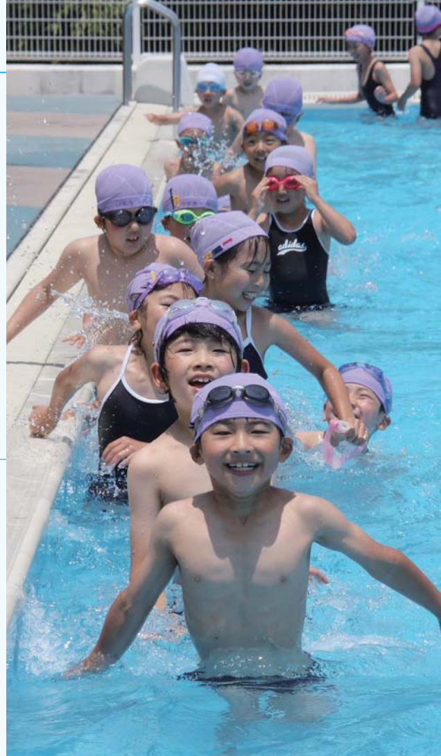
元気にプールを楽しむ児童(岩邑小学校で)