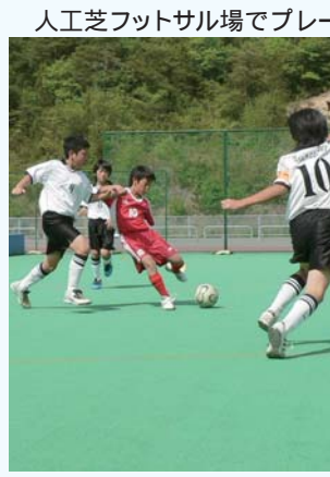
人工芝フットサル場でプレー

とき 7月24日(土)、25日(日)午前8時半 日没または午後7時 【共通】 市体育連盟事務局 25 64 78(月曜日は休館)