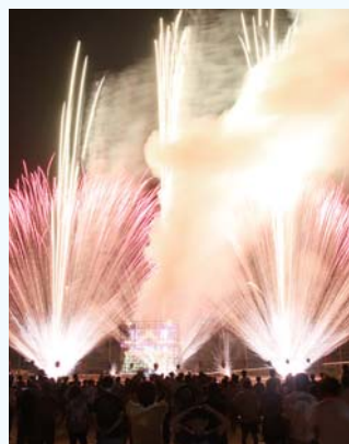
ザ・縁日の名物「音楽花火」

とき 8月13日(金) 縁日8月13日(金)午後7時半 ところ 岩村グラウンド 問 岩村城再建構想実行委員会(恵那市恵南商工会岩村支所内) 43 2636