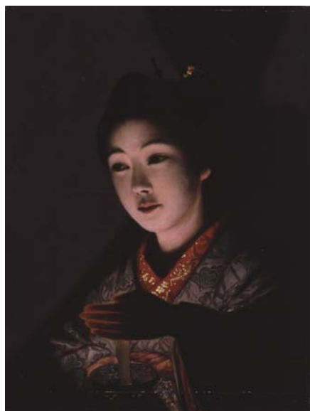
灯を持つ乙女 = 1892(明治25)年ころ。芳翠存命中から生家にあり、地元になじみの深い作品。(県美術館寄託)