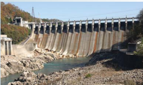
日本のハイダム技術の原点となった大井ダム