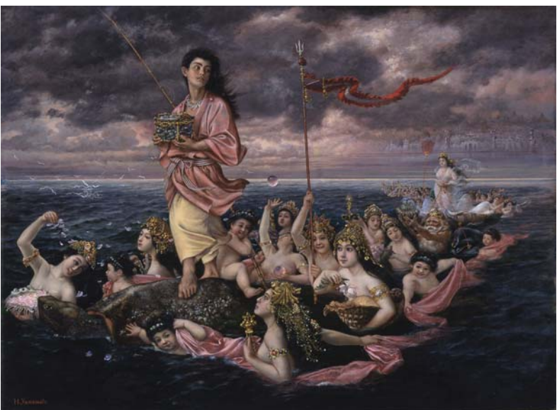
浦島図 = 1893(明治26) ~ 1895(明治28)年ころ。第7回明治美術会に出品された迫力ある大作。浦島太郎という日本的主題を洋風表現した芳翠の作例の一つ。(県美術館所蔵)

1906(明治39)年、芳翠は56歳で他界。日本洋画の発展に情熱を捧げた芳翠は、その最期も作品の制作中のことでした。