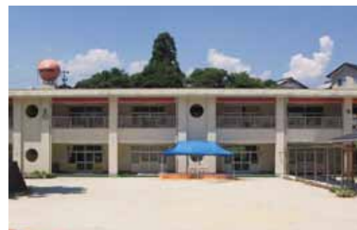
▲城ヶ丘保育園(大井町)

□申し込み方法 毎月20日から、利用する翌月1ヵ月分の申し込みを受け付けます。城ヶ丘保育園に電話で申し込みください。なお、利用日の7日前までに、申し込んでください。 □利用できる日 月～土曜日(祝日を除く)の保育所の開所日 □保育時間 午前8時半～午後4時半 □利用料金 1人1時間300円 ※希望者のみ給食代1人1日200円(おやつ代含む) 申・問 城ヶ丘保育園 25-2539 問 子育て支援課児童施設係(内線261)