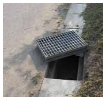
▲鋼鉄製のふた(グレーチング)

全国的に、鉄製品の盗難が多発している中、市内の市道や国道などの側溝でも、6月ごろから鋼鉄製のふた(グレーチング)の盗難が相次いで発生しています。