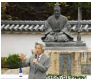
▲昨年の言志祭には、小泉純一郎首相も参加した