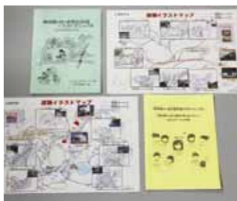
▲イラストマップ、マニュアル

市手話通訳連絡会と市、聴覚障がい者福祉協会は、聴覚障がい者の現状をよく知る立場から、昨年、市民提案型協働事業で、聴覚障がい者に配布する「聴覚障がい者用防災対策イラストマニュアル」と「聴覚障がい者用避難イラストマップ」を作成しました。