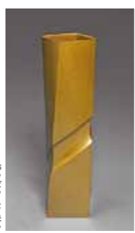
▲新人賞受賞作品「黄銅四方花器『光彩』」