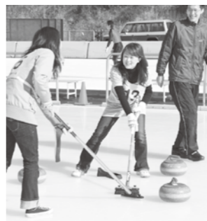
▲カーリングの体験