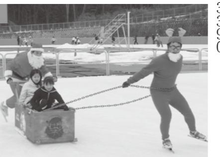
▲サンタさんとソリに乗ろう