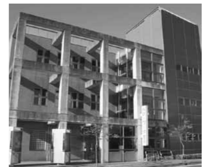
▲ハローワーク恵那の建物