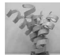
彫塑工芸「響ひびき」