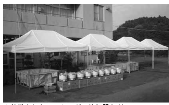
▲整備されたテントやガス炊飯器など

飯地町自治連合会では、自治総合センターが行う宝くじ普及広報事業で、コミュニティ（自主防災育成）助成事業の助成を受けて、テントやガス炊飯器などの防災資機材を整備しました。同会では、災害時に備えて、地域で協力して対応できる体制づくりを目指しています。 この制度は、宝くじなどの受託事業収入を財源に、市町