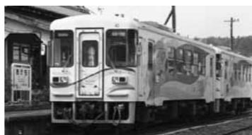
▲ 25周年を迎える明知鉄道

当事者と向かい合いながら、また支援する家族自身の生活をどのように維持するかを知る機会として、気軽に参加ください。 □ 対象 16歳以上で、ひきこもりや社会参加に消極的になっている方の家族 ※精神科疾病が原因でひきこもっている方は、別途教室を案内します □ 参加費 無料