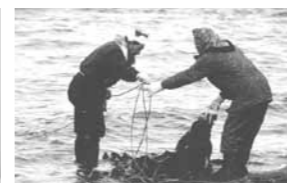
写真「夜明けの昆布漁」