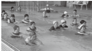
▲プールで運動する参加者