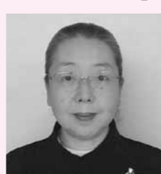
▲大関啓子氏。実践女子大学文学部教授、実践女子学園生涯学習センター長

□定員 900人(先着順) □問い合わせ 社会教育課 43-2112(内線341)