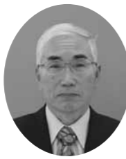
任期 平成22年12月16日～平成25年12月15日