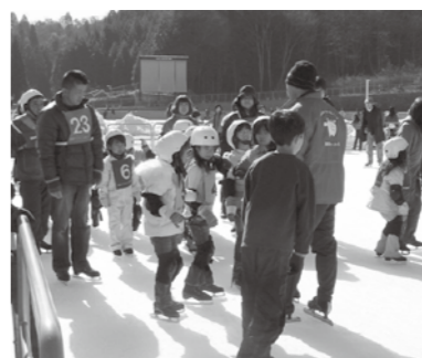
▲昨年のスケート教室で基礎を学ぶ