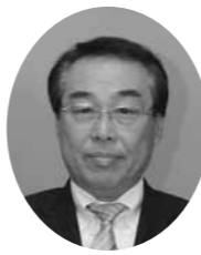
任期 平成22年12月22日～平成24年11月27日