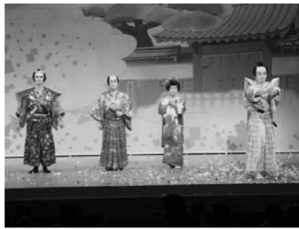
▲昨年のお目見得だんまり

地歌舞伎や文楽、獅子舞、太鼓など、市内に古くから伝わる伝統芸能が一堂に会し披露します。