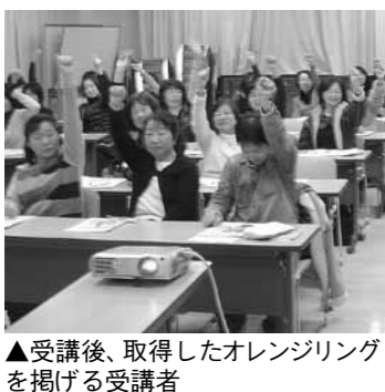
▲受講後、取得したオレンジリングを掲げる受講者

認知症や認知症サポーターとは何か。サポーターの役割を学びます。参加を希望する方は、地域包括支援センターへ申し込みください。 □とき ▽明智公民館 2月10日(木)午後7時 ▽岩村公民館 2月22日(火)午後7時 ※参加したいけれど都合が悪い、遠くへ行けないという方は、日時と場所を設定して