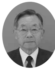
任期 平成22年12月16日～平成26年12月15日