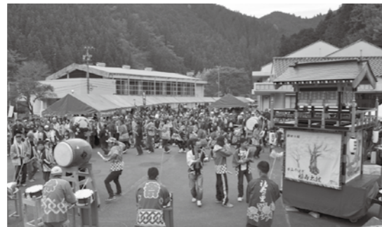
▲整備された山車や太鼓を使って祭りに参加

上矢作町太鼓保存会では、コミュニティ活動の充実と伝統文化の継承のため、自治総合センターのコミュニティ助成事業により、山車の製作と不足していた太鼓の購入を行いました。