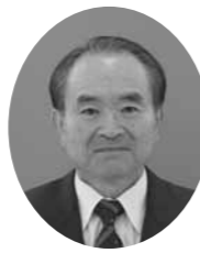
任期 平成22年12月16日～平成26年12月15日