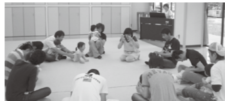
▲子どもと楽しく触れ合うお父さん

日ごろ忙しいお父さん、時には親子触れ合い遊びに参加しませんか。子どもたちの大好きな触れ合い遊びを、楽しく覚え、親子の絆を深めましょう。