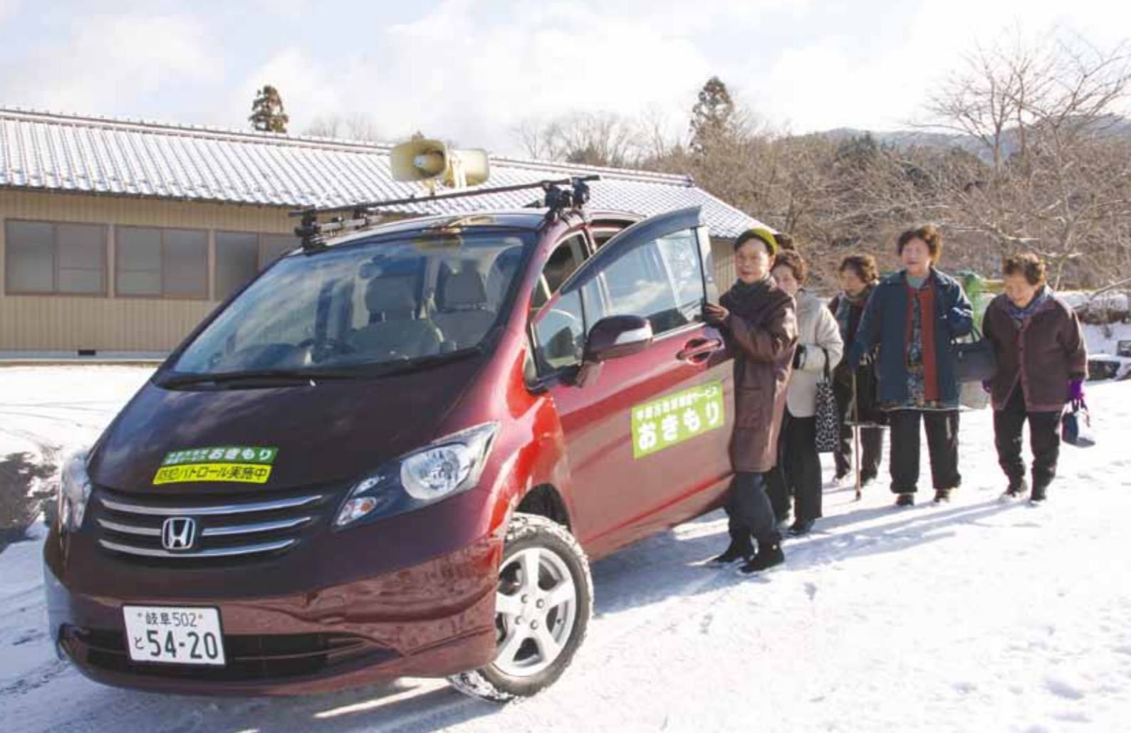
▲協働事業で運行されている中野方町の「おきもり」。雪道の中、中野方保育園児との交流会へ向かう方々を送迎した。高齢者など交通弱者にとって、貴重な移動手段となっている

行動計画の取り組みは五つの柱に分かれ、その柱ごとに基本目標を示しています。この行動計画は、次ページから詳しく紹介します。