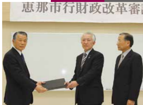
▲可知市長に答申書を手渡す小椋会長と山本副会長