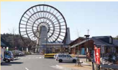
▲道の駅「おばあちゃん市・山岡」