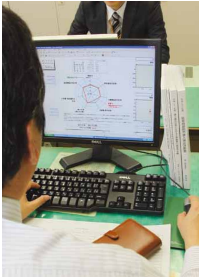
▲バランスの取れた経営には財政を比較分析することも重要

長期的な見通しに基づき、市税などの収納率の向上や滞納処分強化、広告収入の確保など歳入の維持確保を図り、公共施設の指定管理者制度への移行や、公共施設の移譲・廃止、補助金の適正化などを進めます。また、事務