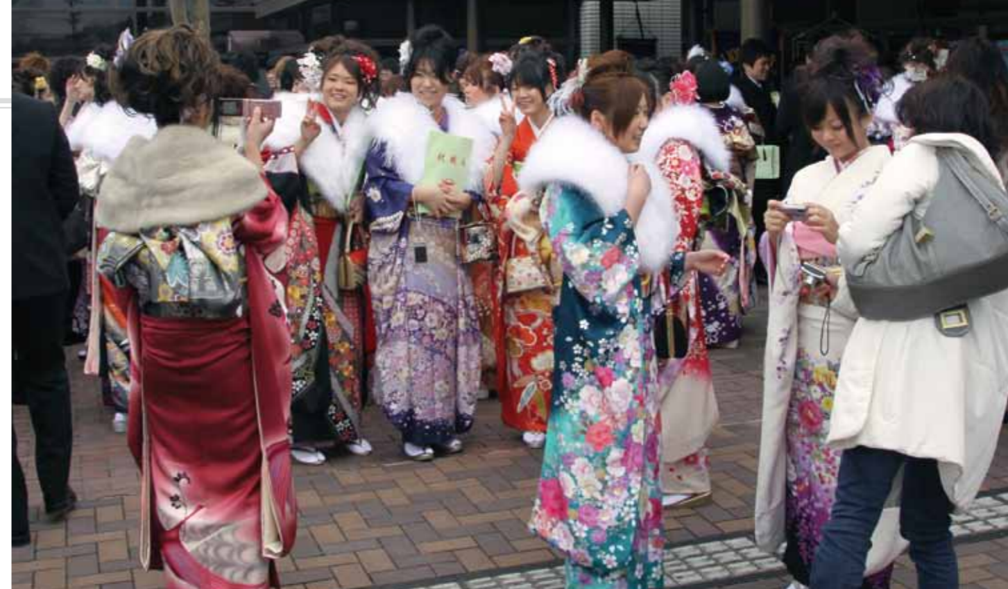
▲初の統一会場になった恵那文化センターで友人らと記念撮影を楽しむ新成人

成人式は、今までの人生を振り返ったり、これからの自分を見つめ直したりする、良い機会です。20年を振り返ると、人として大切にしなければならぬことをたくさん学んできました。これから社会に出て、学ぶことはたくさんあると思います。子どものころから学んできたことを大切に、伝えられる大人になりたい。大人になるまで、健康を気遣い、温かく見守り育ててくれた両親に、感謝の気持ちを伝えたい。ありがとうございました。