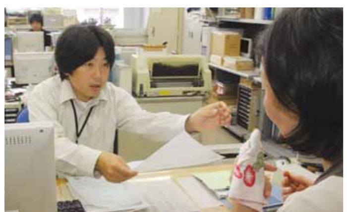
▲市民の目線で仕事に取り組むことで信頼関係を築いていく

市役所はサービス機関である以上、市民の立場からの目線が欠かせません。来庁者窓口サービスアンケート調査や、市民の満足度や重要度を市民意識調査で毎年計測しながら、サービスの質の向上を図ります。さまざまな取り組みにより来庁者満足度を向上させると共に、市民の暮らし