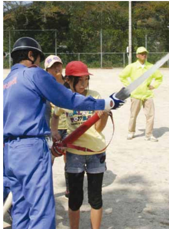
▲地域防災スクールモデル事業では、児童が放水を体験。地域と消防団、小学校が連携して防災を学んだ。(恵那北小学校で)

地域を取り巻く環境が大きく変化しています。社会情勢や価値観の変化に伴い、市民が公共サービスに求めるものは、多様化・高度化し「公共」の守備範囲は拡大してきています。一方「地域の課題は地域自ら考え、