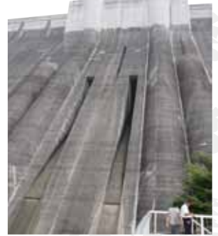
▲曲線をデザインに取り入れた洪水吐導流壁

山岡町の瑞浪市境にあるダム。庄内川(土岐川)の相次ぐ水害から生命や財産を守る目的で、2004(平成16)年に完成した。このダムは国土交通省が直轄管理しており、東濃地域から尾張地域の水害を軽減するほか、河川環境の保全と放流水を利用した発電を目的とした多目的ダム。高さ114mの重力式コンクリートダムで、直線的なデザインの中に、洪水吐導流壁の構造を半円形として曲線を印象づけている点の特徴。建設時の掘削面は緑化などにより、周辺の自然林とマッチした景観も創出。ダムにより形成された「おりがわ湖」のほとりに、水車と新鮮野菜で有名な道の駅「おばあちゃん市・山岡」がある。