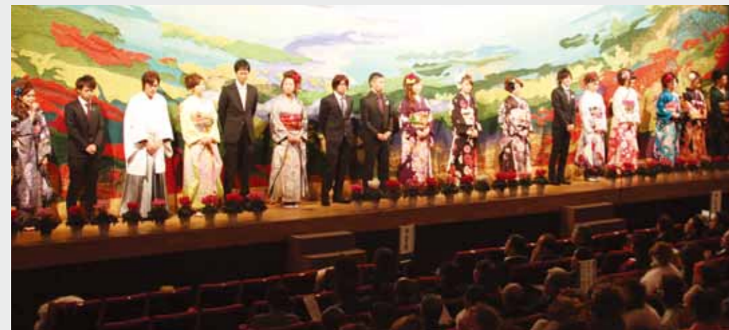
▲ことしの成人式を企画、運営した17人の実行委員。統一開催に向け10月から準備を行って来た

▼まだまだと思っていた成人式を迎え、とても時間の流れを早く感じた。一番に思うことは家族や友達への感謝の気持ち。今は大学生で、まだ将来について明確に決めていない。これを節目に、将来について真剣に向き合う。 ▼ことしから社会人として働く。新しい環境や出会いがあると思う。職場への不安もあるが、働く中で自分の考えや行動をしっかりとしたものにしたい。将来、何がしたいのか、そのためには何をしないといけないのか考えて今まで応援してくれた方々に感謝し頑張る。 ▼私が20年間で、家族や友人、恩師、地域の方々から学んできたことを大切に、次の世代の子どもたちにも、そのことを伝えていく。 ▼成人として恥ずかしくない、責任のある行動を心掛ける。 ▼成人式を迎え、改めて大人への一歩を踏み出したのだと感じた。新たなスタートとして出発する前に、これまで育ててくれた家族や支えてくれた友人、正しい道を示してくれた先生に感謝したい。