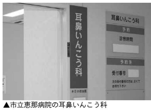
▲市立恵那病院の耳鼻いんこう科

市立恵那病院では、2月から耳鼻いんこう科の午後診察を、週2回に拡大します。 現在 毎週木曜日・午後2時～3時半（学童のみ） 2月以降 毎週月曜日と木曜日・午後2時～3時半（一般の方も対象） 問 市立恵那病院 ☎26-2121