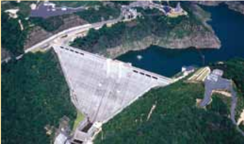
▲小里川ダム(航空写真)