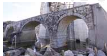
▲與運橋(通称めがね橋)。ダム建設で水没してしまうことから、2003(平成15)年に移築された。

山岡町田代地内の おりがわ 小里川ダム湖畔で、2004(平成16)年に営業を開始した道の駅。この駅のシンボルである直径24mの巨大水車は、完成当時、木造水車として日本一の大きさを誇った。かつて陶土の製造に使われた水車を復元したもので、水の音・木の温もり・水車風景の安らぎなど、ダイナミックかつ癒やしの空間を提供。また、巨大水車の他のランドマークとして、小里川ダム水没地域の歴史を象徴する石造アーチ橋の「 ようんぼし 與運橋」と発電機を移築して展示している。この施設は、地域の農産物や各種特産品をPRしながら販売を行う地域活性化の拠点であり、地元で育てた新鮮な野菜や、手作り品を求めて訪れる都市部の人々との交流の場となっている。