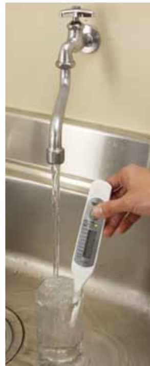
▲水道水の残留塩素を検査

□内容 ①毎日1回、水道水の色や濁り、残留塩素の簡単な測定と記録 ②異常時の通報や水道課からの問い合わせの回答 ③その他、水道に関するモニター