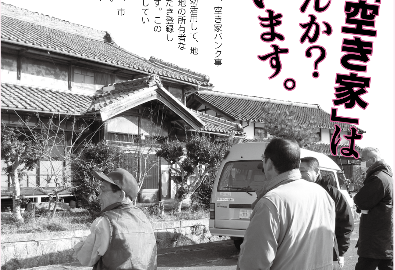
▲現地で空き家などを調査するNPOまちづくり山岡の「交流・定住環境づくり事業委員会」のメンバー