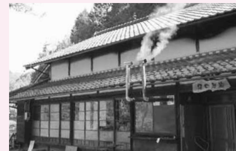
▲さまざまなイベントの会場となる結の炭家