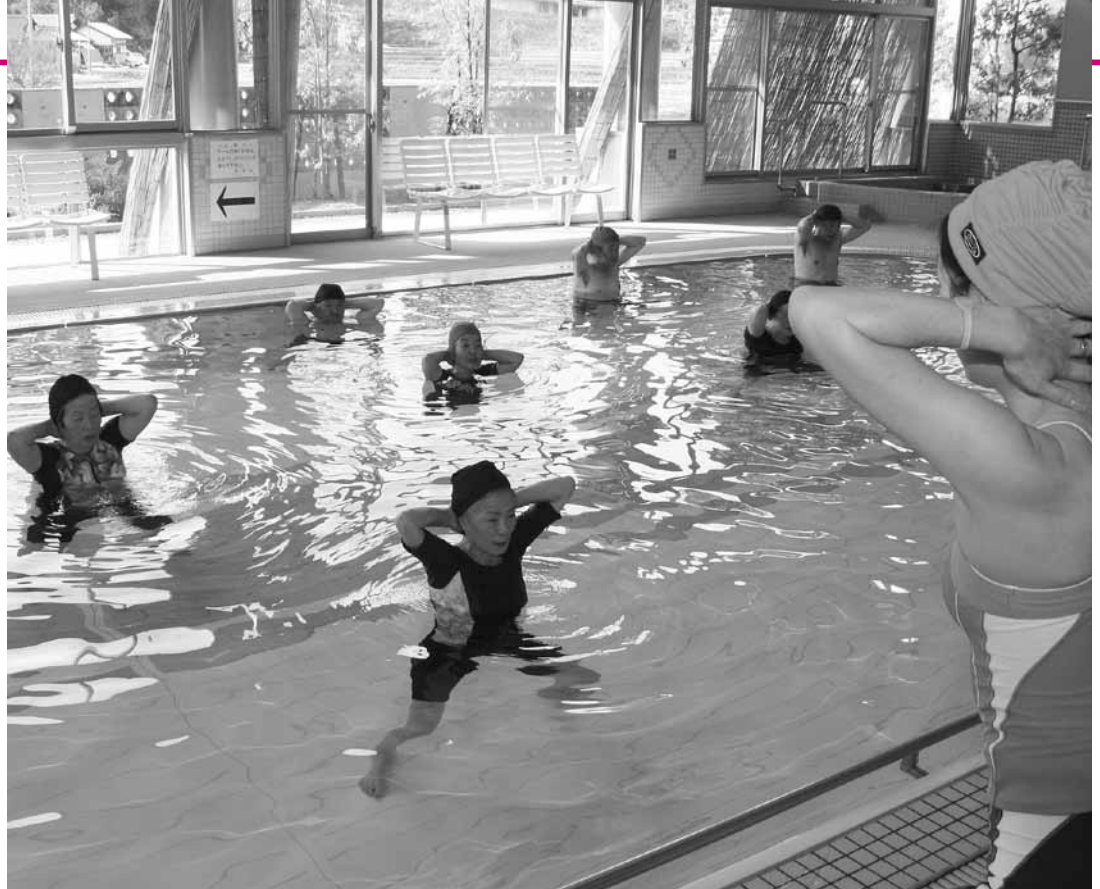
▲運動指導員の掛け声で行う水中運動。水の抵抗で運動量が倍になり、手軽に有酸素運動ができる

市民の「健康長寿」をテーマに保健・福祉・医療の連携で質の高いサービスを提供しようとする、一体的に整備された複合施設の健康プラザ。今回はその中の一つで、誰もが楽しく運動できる健康増進センターを紹介いたします。 □問い合わせ 健康増進センター ☎56-4066、社会福祉課（内線131）