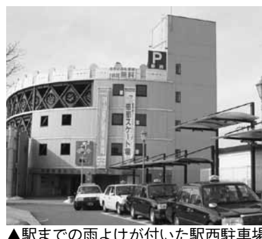
▲駅までの雨よけが付いた駅西駐車場

恵那駅西駐車場の定期利用者を募集します。恵那駅までの雨よけが設置され、より利用しやすくなった恵那駅西駐車場を、ご利用ください。現在、定期利用中の方で、