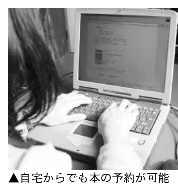
▲自宅からでも本の予約が可能

このサービスを利用するには、図書カードとパスワードの設定が必要です。事前に、図書館のカウンターでパスワードを登録してください。パスワードの登録後、図書館のウェブサイトトップページ「かんたん検索」から本を探します。利用券番号(7桁)とパスワード、受取希望