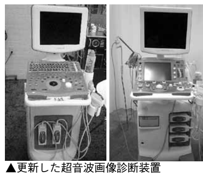
▲更新した超音波画像診断装置