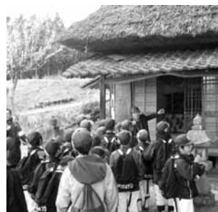
▲歩こう会では郷土史研究会の方が史跡を説明