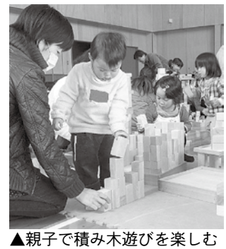
▲親子で積み木遊びを楽しむ