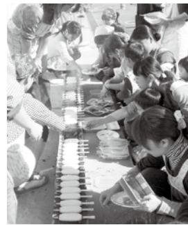
▲五平餅を楽しむ親子