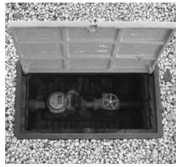
▲各戸の水道メーターを検針