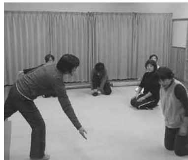
▲出前講座で行われたヨガ教室