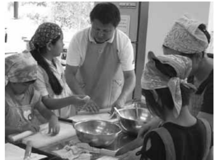
▲正月料理を作ったモンゴル料理教室

16日(土)午前9時から、子ども対象の講座は16日(土)午後1時から受け付けます。