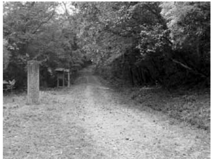
▲現地学習を行う榎ヶ根追分

貴重な歴史遺産の中山道を学ぶ講座を開催します。これは、中山道や沿線の文化財を紹介するガイドボランティアを養成する講座です。本年度は入門編として「中山道かたりへの会」の皆さんの案内で市内の中山道をしつくり歩きます。