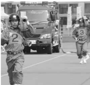
▲おととしのポンプ車操法

市消防協会消防操法大会を開催します。本年度はポンプ車を使った大会です。皆さんもぜひ会場で、消防団員に熱い声援を送ってください。 当日は地震体験車、音楽隊、ラッパ隊のドリル演奏やバザーの出店もします。 8月には、同じ会場で県消防操法大会が行われます。 □とき 5月22日(日)午前8時40分 □ところ 恵那スケート場 ※会場周辺の駐車場が混雑するので、乗り合わせの上、係員の指示に従ってください