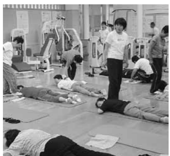
▲体の痛みを和らげる運動

【とき】6月1日～7月27日(毎週水曜日) ①後1時半～2時 ②午後2時20分～2時50分(全9回) 【定員】各20人 【持ち物】水着、スイミングキャップ 【講師】施設職員