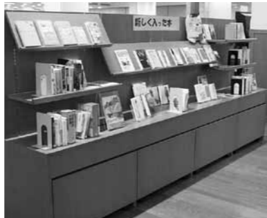
▲新しく入った本コーナー