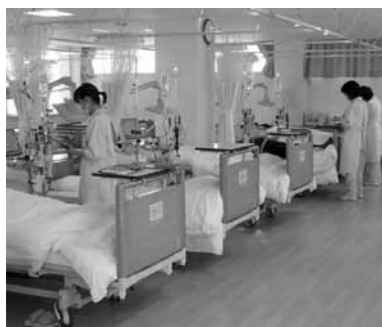
▲岩村診療所内の透析センター

また通院が困難な方には、送迎車の利用も可能です。面談の上、相談させていただきます。