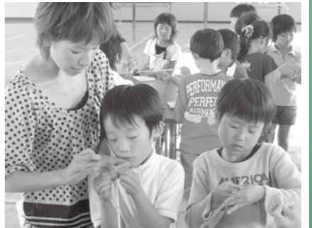
▲割り箸鉄砲を作った「ともだちクラブ」