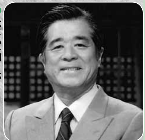
● 松平定知氏 (元NHKアナウンサー)