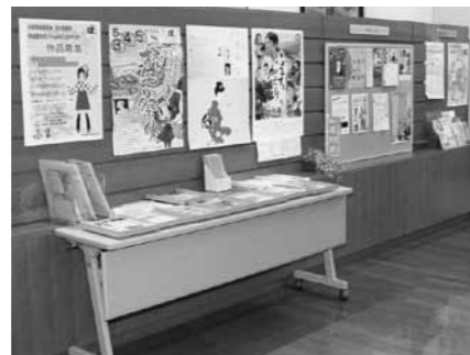
▲入口に設置した情報コーナー

市内情報のお知らせと新刊コーナーを設置 市中央図書館では、市内や県内の情報コーナーを入口に新設しました。観光案内やコミュニティ情報、イベント情報などを掲示しています。