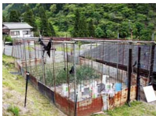
▲猿よけに金網とトタン板で困っている畑

ば電気牧柵の設置だけでなく、さらに内側をトタン板で囲い農作物を見えなくするなど、複数の対策を組み合わせると効果がより高くなります。