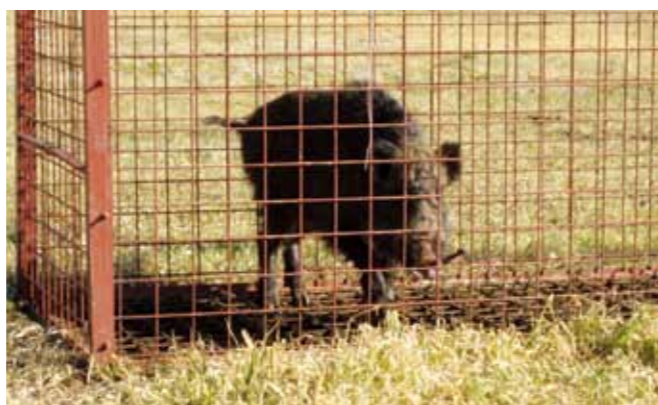
▲箱わなで捕獲したイノシシ

有害鳥獣駆除で捕獲した野生鳥獣は、有害鳥獣捕獲隊員が私有地に埋めています。今後は、埋設場所にも限界があるので、イノシシは獣肉としての活用を検討します。