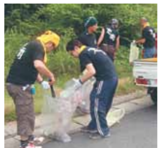
▲昨年行われた清掃活動