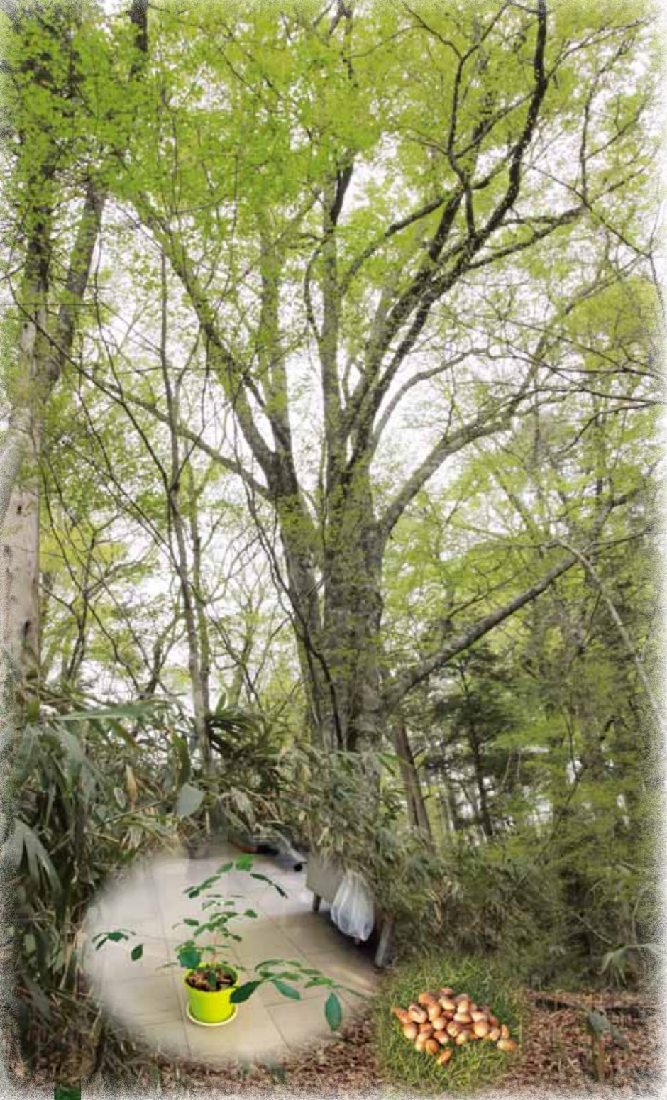
▲苗木の植樹やドングリからの自然再生で広葉樹の森をつくることを目指す

森づくりは、鳥獣害対策だけでなく水資源を蓄える働きや、山崩れや洪水などの災害を防止する働きを高めることにつながります。時間はかかりませんが、現在、私たちが抱える山の問題の多くが解決されます。