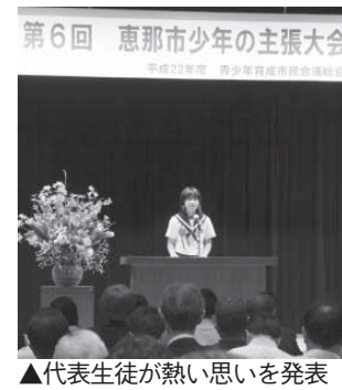
▲代表生徒が熱い思いを発表

市内8中学校の代表生徒 が、社会や世界に向けての意 見、未来への希望や提案など の4テーマと、新たに「ふる さとの先人に学んだこと」を 加えた5つのテーマの中から 熱い思いを発表します。 当日は、市少年少女合唱団 の発表も行います。 皆さんお誘い合わせの上、 ぜひお出掛けください。 □とき 6月18日(土)午後2時 ～4時半 □ところ 恵那文化センター 集会室 □料金 無料 問 社会教育課 ☎43-21 12(内線341)