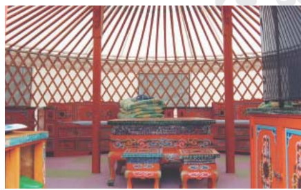
▲鮮やかな色彩が広がる「ゲル」の中。モンゴルから輸入した家具も置かれている

ここは上矢作町とモンゴル国との交流のさらなる発展と、交流人口による地域活性化を目指した施設で、平成12年に営業を開始し、本年度で11年目を迎える。