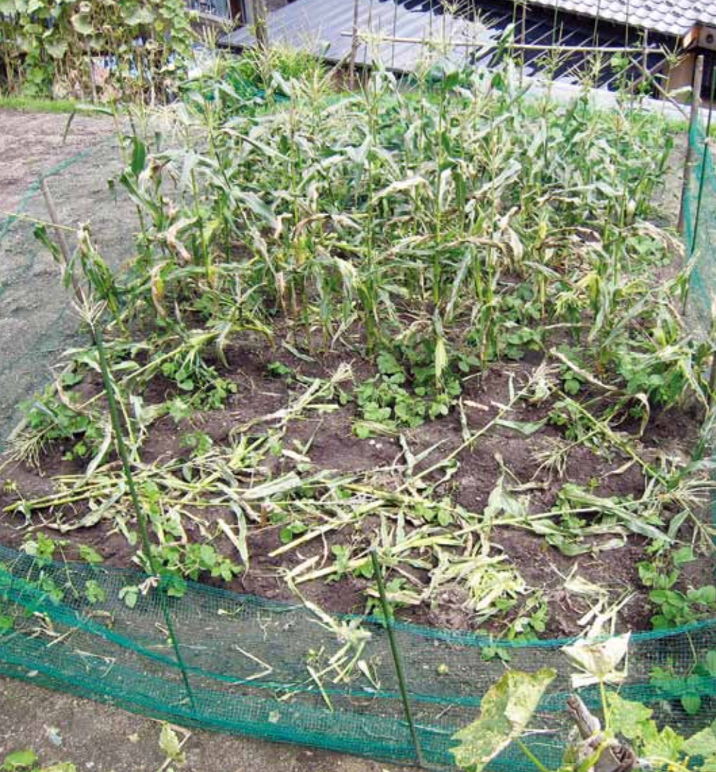
▲猿の食い荒らし被害に遭ったトウモロコシ畑（上矢作町地内）