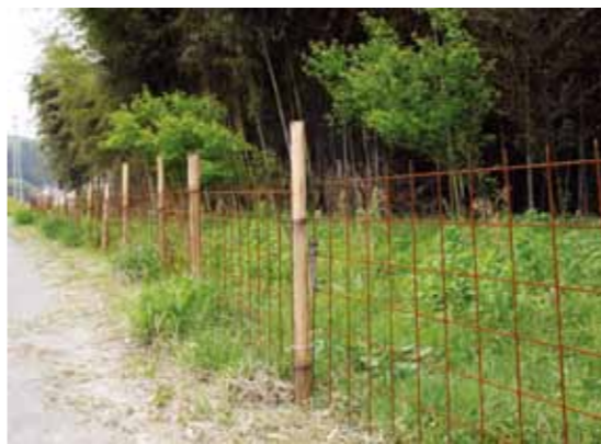
▲上矢作町鳥島地区は集落全体を金網で囲っている

このまま放置すれば被害は拡大するばかりです。地域全体の総合的な鳥獣被害防止対策を検討するため、