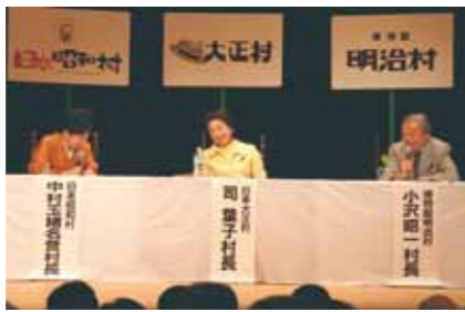
▲平成20年に行われた中村玉緒さんらが出演した日本三村サミット