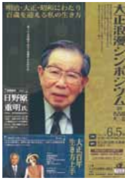
▶日野原重明氏の講演会の案内

どうして市の大正浪漫シンポジウムが名古屋で開かれるのですか。市民軽視のような気がします。それにこの事業は「県からの補助金を受けて