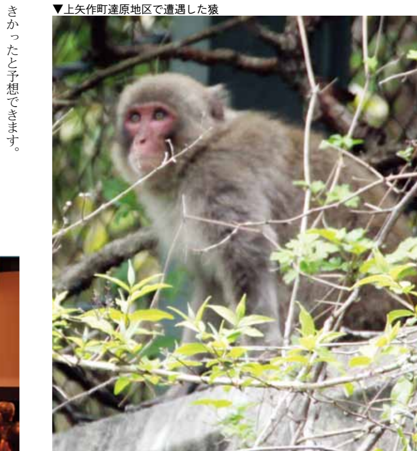
▼上矢作町達原地区で遭遇した猿

アライグマやヌートリアによる農作物や生活環境被害を防除するため防除実施計画を策定。ことし1月現在で、115人が捕獲のための講習を受講。昨年度はアライグマ13頭とヌートリア21頭を捕獲しました。このように対策をしているにも関わらず、被害は拡大する一方です。対策を行わなければ被害はもっと大