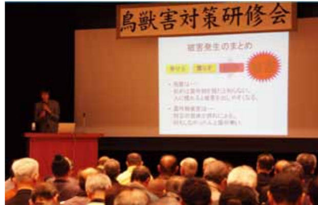
▼2月に開催した鳥獣害対策研修会には約200人が参加

防除や駆除は一時的なものであり、対策をしている集落だけの解決です。防除や追い払いをしても、別の集落へ移動して被害を出します。餌場を追われた鳥獣は、餌を求め、餌が手に入る所へ移動。対策していない地域に被害が発生します。防除や駆除を行っても、その場しのぎの対策にはなりません。根本的な解決