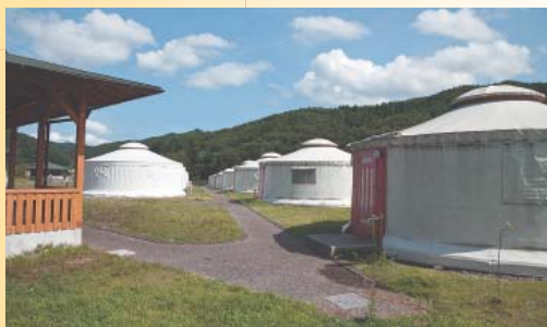
▲モンゴルの移動式住居「ゲル」が立ち並ぶ