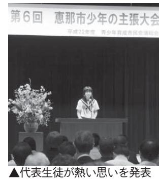
▲代表生徒が熱い思いを発表

市内8中学校の代表生徒 が、社会や世界に向けての意 見、未来への希望や提案など の4テーマと、新たに「ふる さとの先人に学んだこと」を 加えた5つのテーマの中から 熱い思いを発表します。 当日は、市少年少女合唱団 の発表も行います。 皆さんお誘い合わせの上、 ぜひお出掛けください。 □とき 6月18日(土)午後2時 ～4時半 □ところ 恵那文化センター 集会室 □料金 無料 問 社会教育課 ☎43-21 12(内線341)