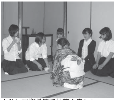
▲ひし屋資料館で抹茶を楽しむ

市茶道連盟に協力をいただ き、中山道ひし屋資料館の茶 室で抹茶の体験ができます。 この資料館は、江戸から明 治にかけて大井宿で栄えた商 家で、大井村の庄屋も務めた 旧家を改修したもの。豪壮な 町屋建築の母屋と趣のある茶 室や庭などが往時の雰囲気 を伝えています。 この機会に、ぜひお立ち寄 りください。 □とき 6月25日(土)午前10時 ～午後3時 □ところ 中山道ひし屋資料 館茶室