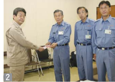
1、辺り一面ががれきりとなっている（陸前高田市にて） 2、福島県へ市長が義援金を手渡す（福島県庁にて） 3、陸地へ打ち上げられた大型漁船（気仙沼市にて） 4、市長が被害の状況を見て回った（陸前高田市にて）

の様子は衝撃的なものでした。さらに災害対策本部では、被災者からの要望に応える難しさを肌感じました。市長自ら行った今回の訪問で、被災状況を直接確認し、実感したことを今後の市の防災に役立てていきます。マグニチュード8以上の地震が、30年以内に87%の確立で発生するといわれている東海地震。市では、これに備え、防災の在り方や避難の方法などを早期に見直すこととしています。被災地へは、まだまだ息の長い支援が必要です。皆さんからの温かい支援を引き続きお待ちしております。