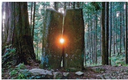
▲夏至の日に、隙間から日の出が見えるという長島町鍋山のメンヒル

イワクラとは、現代の神社やお寺などの本殿に相当する超古代の山岳祭祀遺跡のことを言う。今から約4千年以上も昔、三角岩や巨大石など、不思議な形をした大小さまざまな岩をご神体の岩として祭ったもので、「磐座」と書き表す。山岡町には「野田」、「別荘」など数々の巨石群がある。