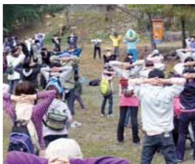
▲ウォーキングの前にミナモ体操