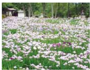
▲見頃を迎える三好学にちなんだショウブ園(岩村城山城址公園内)