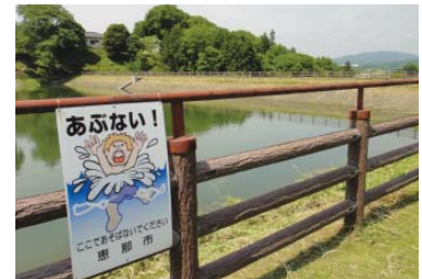
▲ため池に設置してある注意看板