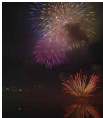
▲湖面にも光が映る水上花火

大正百年を記念した花火大会。夜空と湖面が彩られる恵那峡の花火大会は、水上花火と打ち上げ花火の共演が見もの。恵那峡の峡谷に迫力のある音が響きわたります。放生会、灯笼流し、水上花火大会を行います。 □とき 7月30日(土)▽放生会、灯笼流し▽午後7時▽水上花火大会▽午後8時 問 市観光協会 ☎25-4058