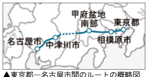
▲東京都一名古屋市間のルートの概略図

リニア中央新幹線（東京都一名古屋市間）のルートは、東京都内の東海道新幹線品川駅付近を起点とし、山梨リニア実験線（全体で42.8キロ）、甲府市付近、赤石山脈（南アルプス）中南部を