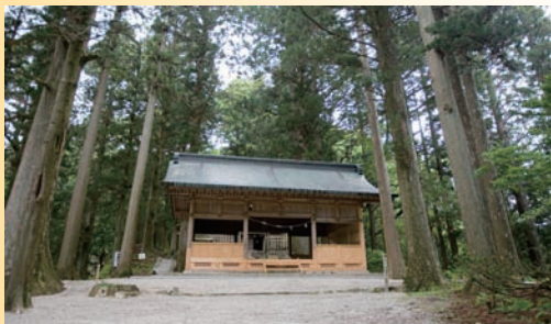
▲大船山にある大船神社