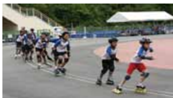
▲インラインスケートを楽しむ子どもたち

児は保護者同伴でお願いします) □無料の水泳教室 午後2時から行います。希望者は、当日申し出てください。 問 市体育連盟事務局 インラインスケート無料開放 □とき 7月24日(日)、8月28日(日)午前8時半〜午後7時 □ところ 恵那スケート場 □無料スケート教室 ①午前9時半②午後1時 ※貸し靴は有料(500円) 問 恵那スケート場 インラインフェスティバル2011 インラインスケートのタイムトライアルや、スラローム発表会。参加希望の方は、事前に問い合わせください。 □とき 8月20日(土) □ところ 恵那スケート場 問 恵那スケート場 問 ▽市体育連盟事務局 25-6478(月曜日は休館) ▽恵那スケート場 28-3339(月曜日は休館)