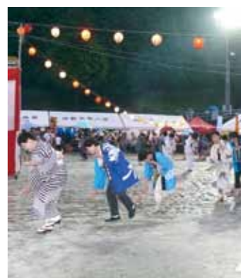
▲夏祭りといえば盆踊り

各自治会による出店や花火(約300発)、盆踊りなどを行います。 □とき 8月13日(土)午後5時50分 □ところ 中野方ふれあいグラウンド 問 中野方夏祭り実行委員会(中野方コミセン内) 23-2113