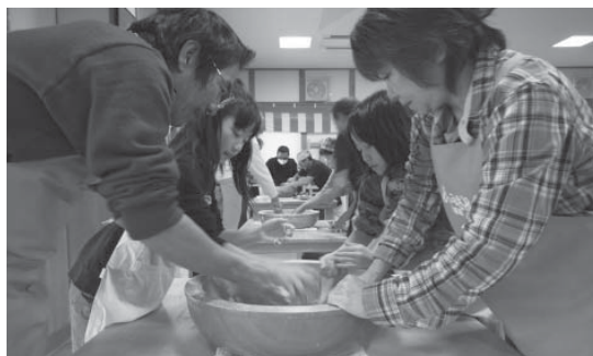
▲収穫したソバでそば打ちを体験

道の駅「らっせいみさと」 では、ソバの種まきから収穫、そば打ち体験を一般の方を対象に開催します。 ソバの栽培を通して、農業体験をしてみませんか。皆さんの参加をお待ちしています。 □とき 8月20日(土)～11月27日(日)午前10時～午後2時 □料金 ▽大人116,000円 ▽子ども14,000円(3歳～中学生)