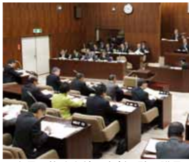
▲市長の施政方針を真剣に聴く議員

定数は、地方自治体の人口や財政規模などを、総合的に判断して決めている。議員報酬は、議会が運営された日数に応じて支給。政務調査費などの経費は、一定の基準に照合して決める、という革新的