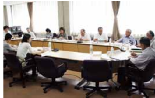
▲事業の選定方法などを話した第1回目の委員会

市外部評価試行委員会の提言書は、市役所や各振興事務所、市中央図書館の情報公開コーナー、市ウェブサイト