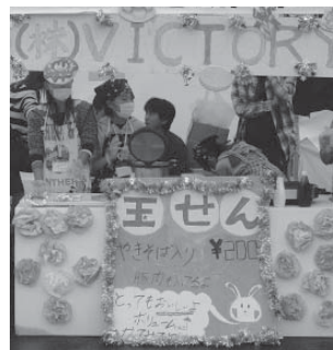
▲模擬株式会社で販売を体験

ジュニアエコノミカレッジとは、ビジネスの体験を通して「自分たちで挑戦する楽しさ」「買ってもらう楽しさ」「仲間が増える楽しさ」を目指した体験学習です。2万円を元手に模擬株式会社を設立。その中で、ビジネスプランや利益の分配などを体験し、国語や算数を学ぶ意味や税金、金利の仕組みなどを