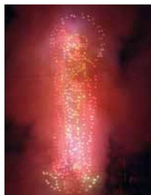
▲お地蔵さんの仕掛け花火

約300年の歴史と伝統技法を今日に伝える花火大会。仕掛け花火やスターマイン(約1000発)を打ち上げます。 □とき 8月16日(火)午後7時