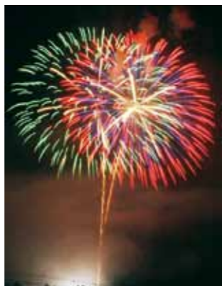
▲夜空を彩る打ち上げ花火

大正百年を記念した花火大会。明智町全域に、ごう音が鳴り響く尺玉を含む、打ち上げ花火やスターマインなど(約1000発)。ステージイベントやバザーなども行います。 □とき 8月14日(日) ▽バザー 11時～午後3時 ▽花火大会 11時～午後7時半 □ところ 日本大正村駐車場周辺 問 明智町納涼花火大会実行委員会(明智振興事務所内) 54-2111