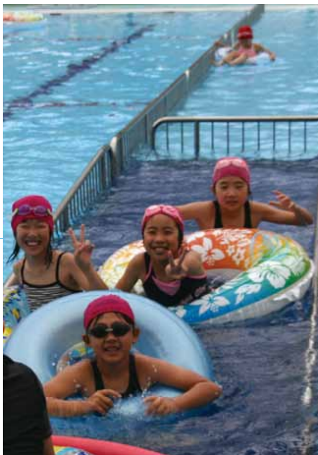
▲上矢作プールで冷たい水に親しむ子どもたち

市内のスポーツ施設の無料開放や、インラインスケートの発表会などについて紹介します。