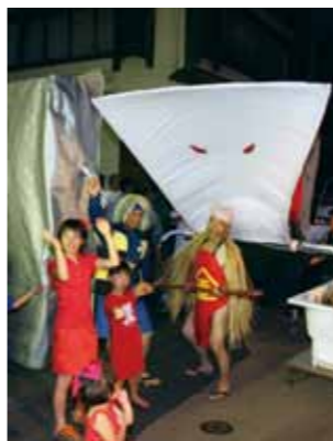
▲大人も子どもも大変身

昭和23年に始まった歴史ある変装行列です。町内会などが工夫を凝らした変装や企画で町並みを練り歩きます。また手作りの出し飾りや、あんどんなども見ものです。 □とき ▽大変装行列 8月6日(土)午後6時 ▽子どもみこし 8月7日(日)午後1時 □ところ 岩村町本通り