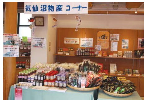
▲えなてらすで取り扱う現地の特産品

7月3日(日)、8月7日(日)は、市民の日(市民に限り観覧料が無料です。当日、受付係に「恵那市民です」とお伝えください) 問 中山道広重美術館 ☎ 20-0522