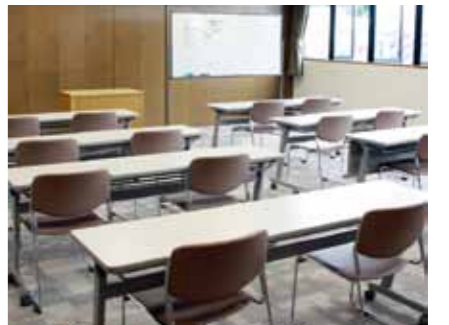
▲開放する2階のセミナールーム

それ以外の席については、お互いに譲り合いながら、利用をお願いします。夏休み期間中は、催し物がないときに、2階のセミナールームを開放しています。自習する方は、こちらを利用してください。