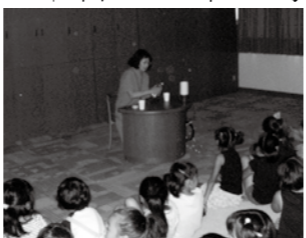
▲話は暗い部屋で聞きます

後2時〜2時半 □ところ 市中央図書館セミナールーム 問 市中央図書館 25-51220 カラフルテープでアニメルモビール作り 紙テープを折ったり曲げたりしながら、動物のモビールを作ります。 □とき 7月31日(日)、8月7日(日)午後1時半〜4時 □ところ 中山道広重美術館講座室 □対象 小学生 各日20人 □定員 各日20人(定員になり次第締め切り) □材料費 400円(保護者同伴の場合)、入館料500円が必要) □持ち物 水筒、のり、はさみ、筆記用具、色鉛筆、ペン、シールなど飾りに使いたいもの □申し込み 電話で申し込み 申・問 中山道広重美術館 20-0522 まちかど版画展 in 岩村町 第7回広重賞市子ども版画コンクールで特別賞と奨励賞に入賞した作品を展示します。