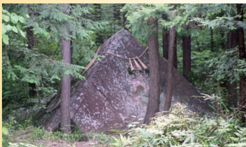
▲笠置山にあるピラミッド状のペトログラフ