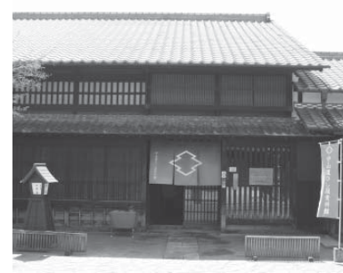
▲会場となるひし屋資料館

県世界淡水魚園水族館「アクア・トトぎふ」は、平成16年に世界最大級の淡水魚水族館として開館。7月14日には、