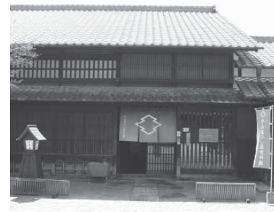
▲会場となるひし屋資料館

市茶道連盟と琴の三社中に協力いただき、中山道ひし屋資料館で抹茶の提供と琴の演奏を行います。 この資料館は、江戸から明治にかけて大井宿で栄え、大