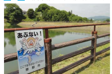
▲ため池に設置してある注意看板