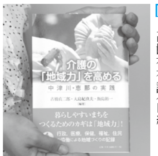
▲発刊された記念誌

自身や家族の心配ごとを、専門の相談員が、無料で相談に応じます。相談を希望する方は、地域包括支援センターへ申し込みください。