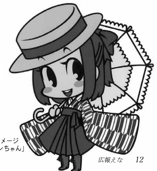
▶日本大正村イメージキャラクター「ロマンちゃん」

東北が、日本全体が、一日も早く元気になる事を祈願して、明智かえでホールから大正村浪漫亭まで提灯行列を行います。どなたでも参加できます。浴衣や着物での参加大歓迎です。