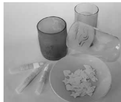
▲型紙などで模様を付ける