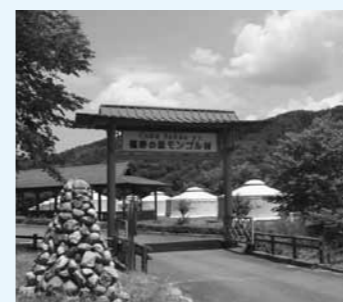
▲キャンプ地となるモンゴル村

詳しくはウェブサイト http://fukuiju-no-sato.com を確認してください。