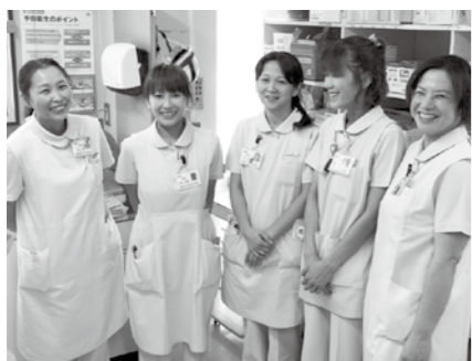
▲上矢作病院で働く看護師のみなさん