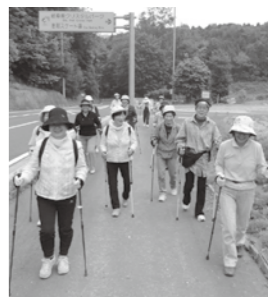
▲ポールを使って歩くノルディックウォーク