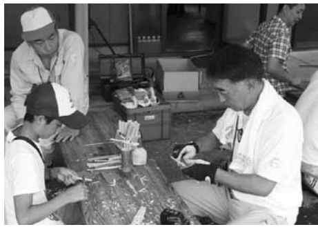
▲竹とんぼをつくる子どもたち

ぎふ山の日イベント 8月は山に親しむ月間です。岐阜の山で育った木材を使い、体験できるイベントを開催します。木と触れ合って、夏休みのひと時を楽しく過ごしてみませんか。 □とき 8月7日(日)午前9時～午後2時 □ところ 県森林組合連合会 東濃支所(長島町永田) □内容 クラフト体験(無料)、木工教室(先着100人)、まき割り体験など □料金 無料(木工教室は、