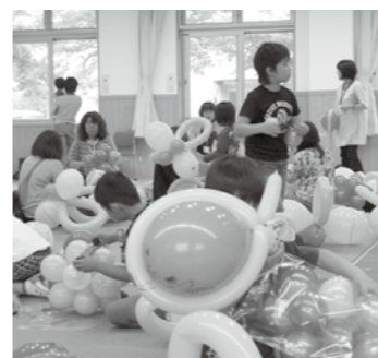
▲風船遊びを楽しんだ交流会

この届けは、児童扶養手当を引き続き受給する要件を確認するもので、8月分からの手当の支給額を決定する大切なものです。届けを提出しないと、8月分以降の手当が支給できなくなることがあります。