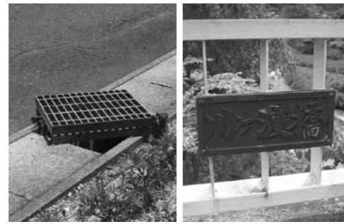
▲グレーチング ▲橋銘版

またグレーチングや橋銘板が紛失している場所を発見したときは、建設課まで連絡ください。