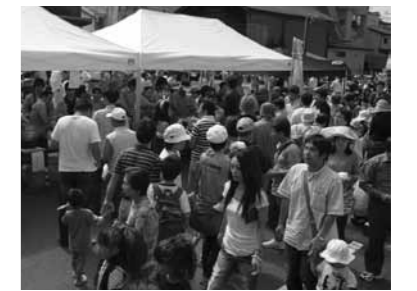
▲秋に開催される「みのじのみのり祭」は、毎年多くの人でにぎわう