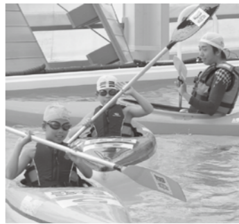
▲プールでカヌーを学ぶ