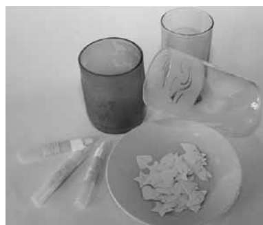
▲型紙などで模様を付ける