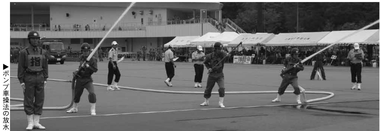
▶ポンプ車操法の放水