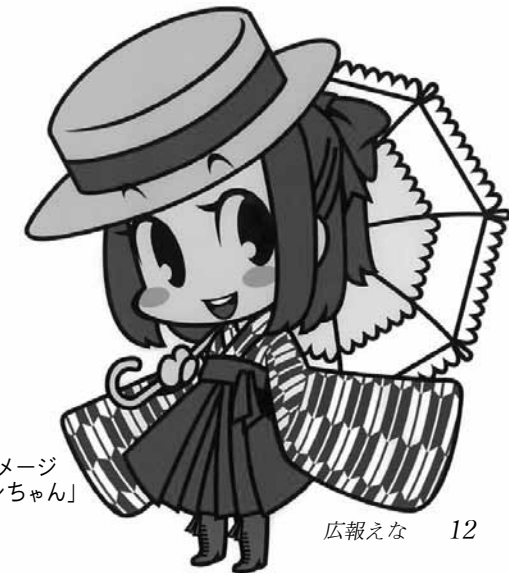
▶日本大正村イメージキャラクター「ロマンちゃん」

東北が、日本全体が、一日も早く元気になる事を祈願して、明智かえでホールから大正村浪漫亭まで提灯行列を行います。どなたでも参加できます。浴衣や着物での参加大歓迎です。