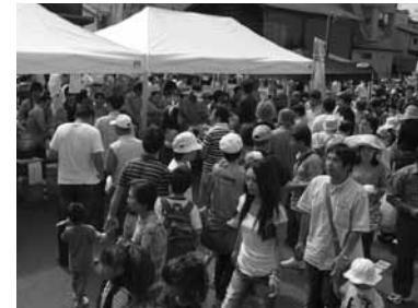
▲秋に開催される「みのじのみのり祭」は、毎年多くの人でにぎわう