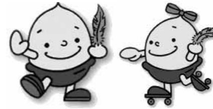
▲どんぐり君とどんぐりちゃん