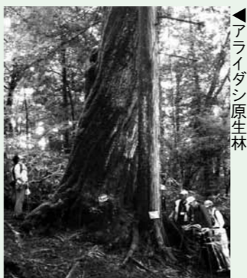
▲アライダシ原生林

新緑と雄大な自然探索を楽しみませんか。 □とき ▽アライダシ原生林 散策 5月13日、6月10日、6月24日、7月15日、8月5日 (日曜日) ▽大船山、松並木散策 7月8日、9月16日 (日曜日) □定員 20人 (先着順) □料金 2000円 (入山料、保険料、ガイド料、軽食代含む) □申し込み方法 ①住所②氏名③電話番号④参加予定日をはがきか電話、ファクス、電子メールで申し込む。 申・問 〒509-750 1上矢作町3516番地4 NPO法人福寿の里自然倶楽部 ☎ 47-3151 fax tukujyu@nposizen.enat.jp