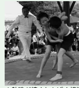
▲熱戦が続くわんぱく相撲

□とき 5月5日(土)午前9時～午後3時ごろ □ところ 春日野記念相撲場 (明智町千畳敷公園) 問 恵那商工会岩村支所 ☎ 43-2636