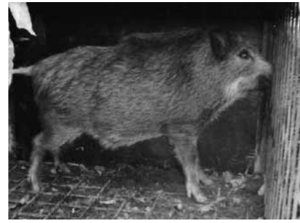
▲箱わなにかかったイノシシ

今回はウォーキングで根の上散策を行います。 とき 5月16日(水)午前10時～午後3時 ところ 根の上高原 内容 恵那山荘を出発し