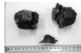
クリーンセンターあおぞらでの混入物

問い合わせ エコセンター恵那 ☎26-4389、恵南クリーンセンター あおぞら ☎0572-65-2203