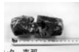
エコセンター恵那での混入物

ができませんでした。不適物の混入はごみ処理をできなくするだけでなく、機械の寿命を短くし、費用も必要以上にかかります。