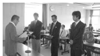
優良事業所への表彰