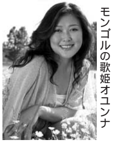
モンゴルの歌姫オコンナ