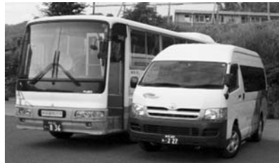
新しく運行するバス

10月から、山岡町内および山岡瑞浪間を運行するバスの運行会社が「ごとう観光バス」から「平和コーポレーション(株)」に変更となり、バスの車輦が変わります。今後も身近な