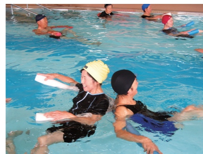
▲泳げなくても安心してできます