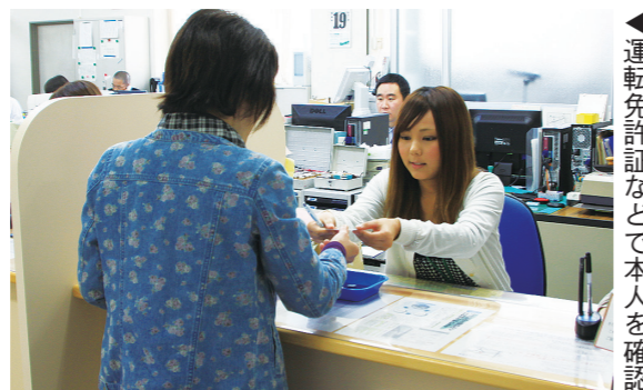
▶運転免許証などで本人を確認