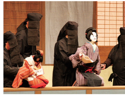
▲民俗芸能などの団体が対象

【条件】 平成26年3月までに後継者育成のために諸費用(道具整備費、製作材料費、育成研修費、記録保存費用)の支出が予定されている