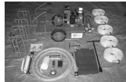
D-1級軽可搬消防ポンプ(積載品)