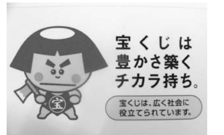
助成事業イメージキャラクター