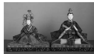
江戸期から伝わるひな人形