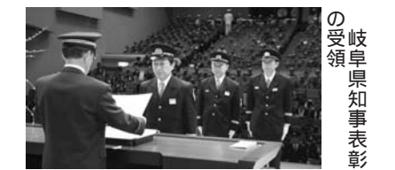
の岐 受 領 岐 阜 県 知 事 表 彰