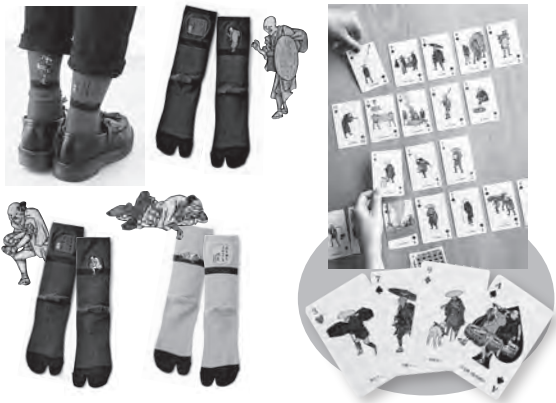
△タビビトソックス 各1,650円 △広重おじさんトランプカード 1,100円 ※価格はすべて税込

ミュージアムショップではフェリシモ「ミュージアム部」とのコラボ商品を販売します。まずは「木曾海道六拾九次之内」に登場する旅人たちが刺繍された足袋靴下、「タビビトソックス」です。デザインは今須・御嶽・みゑじ・伏見の4種類(各2サイズ)。着圧仕様の土踏まず部分が歩行をサポートしてくれます。タビビトソックスを履いて、広重の描く旅人「広重おじさん」と一緒にお出掛けしてみませんか。さらに、広重の描いた4種の東海道【保永堂版・行書版・隷書版・堅絵】から選ばれたおじさんが絵柄になった「広重おじさんトランプカード」もごさいます。トランプで遊びながら、表情豊かで可愛い広重おじさんを是非ご自宅で楽しんでください。