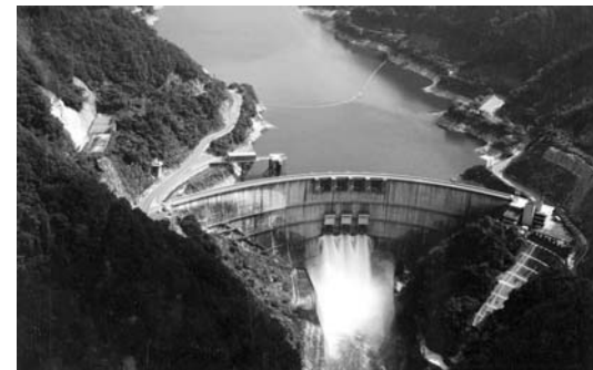
▷矢作ダム（矢作川水系 串原）

日本では数の少ないアーチ式のダムで、放物線を描く美しい形状が特色である。目的は洪水調節、農業・工業・上水の各用水利用のほか、発電も行われている多目的ダムです。