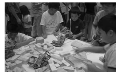
▲昨年の産業博覧会の様子

□問い合わせ 恵那産業博覧会実行委員会事務局(恵那商工会議所内) ☎ 26-1211