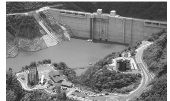
▷小里川ダム（庄内川水系 山岡町）

日本では数の少ないアーチ式のダムで、放物線を描く美しい形状が特色である。目的は洪水調節、農業・工業・上水の各用水利用のほか、発電も行われている多目的ダムです。