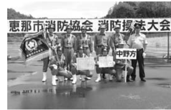
▲優勝した中野方分団

成績は次の通りです。 ▷優勝=中野方分団 ▷準優勝=三郷分団 ▷3位=東野分団 ▷4位=飯地分団 ▷5位=武並分団 ▷6位=上矢作分団 ▷敢闘賞=大井分団