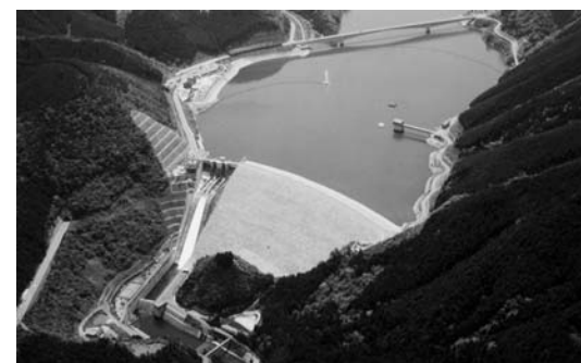
▷阿木川ダム（木曾川水系 東野）

土岐川と小里川の合流点から、上流8.3kmに瑞浪市と恵那市をまたいで誕生しており、①洪水調整②河川の正常な機能の維持③発電の3つの大きな役割を持つ多目的ダムです。