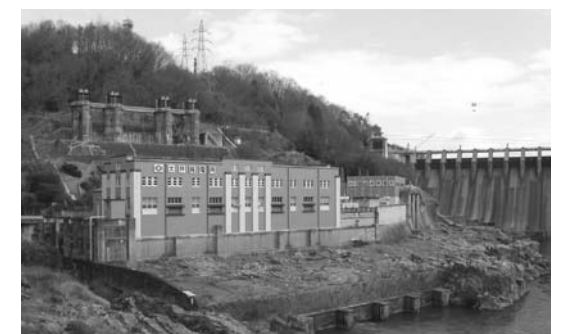
▷大井ダム・発電所（木曾川水系 大井町）

平成3年3月に完成したロックフィルダムで、洪水調節・河川環境の保全および新規利水の供給を目的とした多目的ダムです。