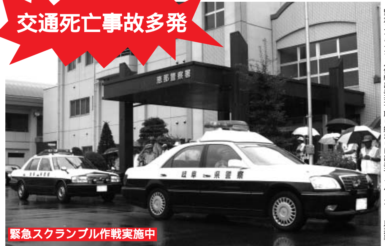
緊急スクランブル作戦実施中