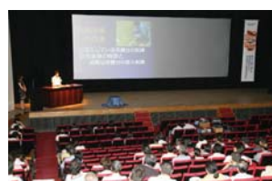
昨年のプレゼンテーション