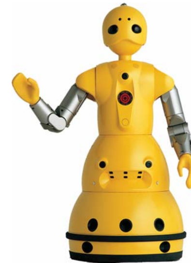
会場では人型コミュニケーションロボット「WAKAMARU」と会話ができます。展示される電気自動車エレクトリックPSデモ走行が行われる三輪自動車「HAGANE-鋼-」