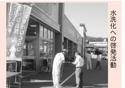
水洗化への啓発活動

融資限度額＝200万円 利率＝3.55%（平成20年度） 償還期間＝5年以内 利子補給金＝償還終了後に支払った利子額を市から助成します（限度額10万円）