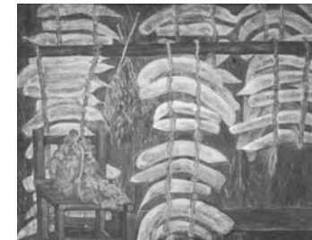
日本画「冬支度」野田豊子(恵那市)