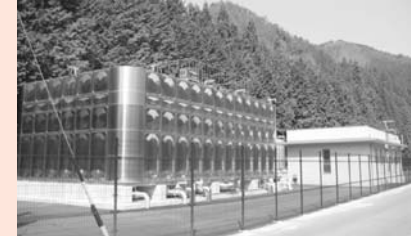
3月に完成した上矢作浄水場

業と、上矢作町の統合事業（H15- H19）、明智町石原田地区の送配水管布設替工事（H19）を行いました。