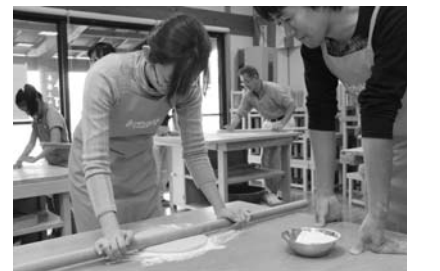
そば打ち体験の様子

体験希望日を事前に予約の上、当日このページの右下にある割引券をお持ちください。1枚で5人まで割引引きをします。