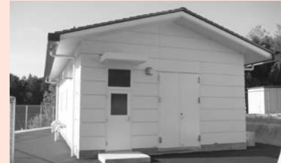
本年度完成予定の乗越ポンプ場

笠置町河合地区（H18- H20）笠置町毛呂窪地区（H17- H22）三郷町棕実地区（H18- H19）の拡張事