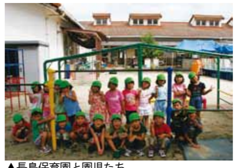
▲長島保育園と園児たち

指定管理者制度を適用している城ヶ丘保育園と長島保育園の入園説明会を開催します。指定管理者制度の概要や申し込み手続き、保育内容の説明、施設見学を行います。 来年度4月以降に入園を希望する保護者は参加ください。 □ところ・とき ▽城ヶ丘保育園 ☎ 9月19日(水)午前10時～11時 ▽長島保育園 ☎ 9月20日(木)午前10時～11時 □申し込み期間 10月1日(月)～10月19日(金) 問 子育て支援課(内線229)