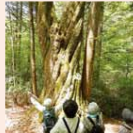
▲ミズナラとサワラの共生木に感動

□とき ▽アライダシ原生林散策Ⅱ10月8日(月)、28日(月)、11月4日(月) ▽大船山