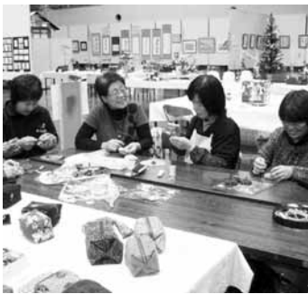
▲体験コーナーで作品作りに挑戦

□日にち 10月13日(土) □時間・内容 ▽午前10時―11時 寄せ植え、華道 ▽午後1時―11時 草木染め、プリザーブドフラワー