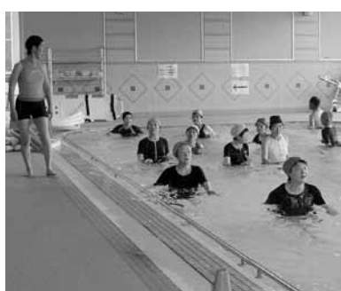
▲泳げなくてもできる水中歩行