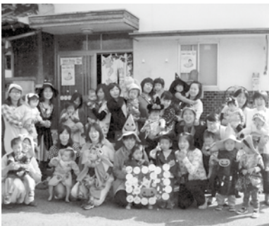
▲出発前に記念写真