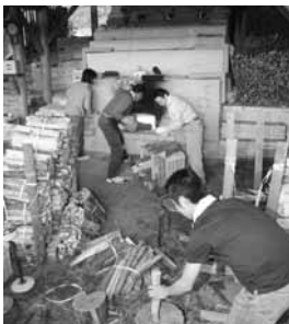
▲窯たきにはたくさんのまきが必要