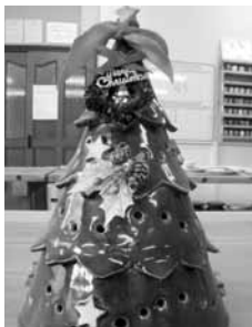
▲クリスマスツリーのようなランプシェード

□とき 10月28日(日)①午前10時―正午 ②午後1時半―3時半 □ところ 山岡陶業文化センター □定員 各15人(先着順)