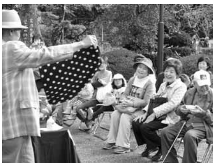
▲回想法センター祭りで手品を楽しむ