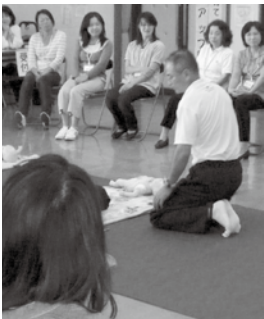
▲乳児の救急救命講習