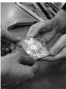
▲本を借りるのに必要な「ほんのカード」