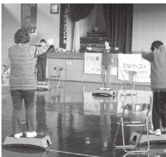
▲踏み台を使ってトレーニング

□とき 10月17日、11月7日、21日、12月19日、平成25年1月16日、30日、2月6日、20日、3月6日、27日(水曜日) 午後1時半～3時(全10回) □ところ 市市民会館 □対象 どなたでも参加できます。 □料金 ▽会員 2000円 ▽非会員 5000円