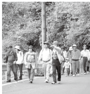
▲クラブ会員がガイドを務める

ノルディックウォーキングで、秋の達原溪谷の景色を満喫した後、平谷温泉で疲れを癒やします。 □とき 10月28日(日)午前8時半(少雨決行) □ところ 上矢作振興事務所 出発 □料金 2100円 □対象 どなたでも参加できます。 □持ち物 タオル、飲み物、着替えなど