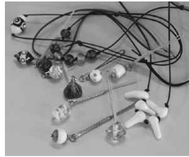
▲美しいトンボ玉を作成する

トンボ玉は、ガラス棒をバーナーで溶かして作り出す。手作りで世界に一つだけのネックレスやキーホルダーが出来上がります。 □とき 10月4日・11日・18日・25日(木曜日)▽午前9時～午後11時半▽午後1時半～3時半 □ところ 恵南クリーンセンターあおぞら □対象 市内在住の方 □定員 8人/回(電話要予約・先着順) □料金 1800円/回