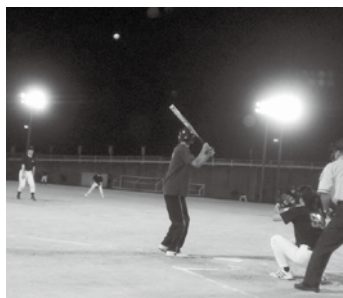
▲トーナメント戦で順位を争うソフトボール大会

まきがね公園杯卓球大会 □とき 10月23日(火)午後7時 □ところ まきがね公園体育館 □対象 市内在住か在勤の方、市卓球協会所属の方 □部門 ラージボールの部、卓球の部 □競技方法 両部門とも3人がシングルスを行う団体戦 □締め切り 10月16日(火)午後5時