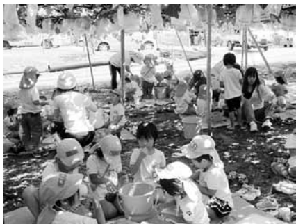
▲ブドウ狩りを楽しむ園児たち

条件は、月の契約者が10人程度とします。また実施が決定した場合は、一時預かり保育も実施する予定です。