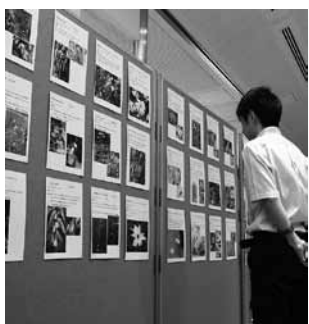
▲写真で希少植物を展示