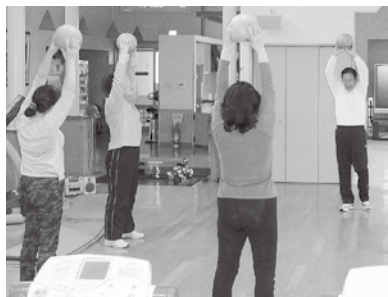
▲ボールを使って筋力アップ(筋トレを暮らしの中に)

□とき 10月5日～11月30日(11月23日を除く毎週金曜日) 午後1時半～2時(全8回) □定員 20人 □持ち物 靴、タオル □講師 施設職員 □料金 無料 ピラティス教室