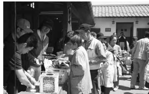
▲多くの人出でにぎわう西町ふれあい広場(岩村町)