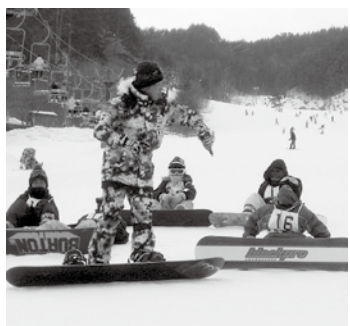
▲講師の話真剣に聞く受講者

□とき 12月18日、25日、平成25年1月8日、15日、22日(火曜日) 午後6時半～7時半(全5回) □ところ 恵那スケート場 □対象 小学生以上 □料金 ▽受講料 1000円(貸し靴代と滑走料は別途必要です) □受付開始日 11月27日(火) 申・問 恵那スケート場 28-3390