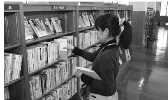
▲市民が利用しやすいよう本の整理を行う