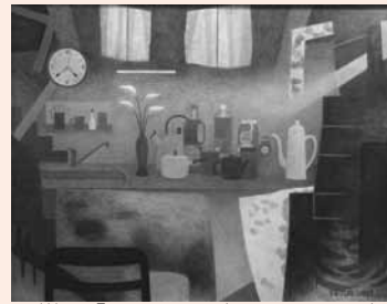
▲洋画「afternoon(アフタヌーン)」