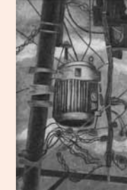
▲日本画「見上げてごらん」