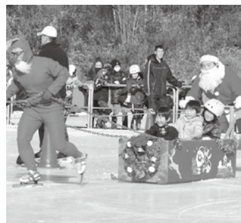
▲サンタさんとソリを楽しむ

オーブン7周年を記念し、滑走料を無料にします。フィギュアスケートの公開演技や無料教室も行いますので、ぜひ、お越しください。 □とき 12月9日(日) □フイギア教室 ▽時間 午前9時半、午後1時 ▽定員 各50人 クリスタル・クリスマス 高校生以下の滑走料が無料です。菓子すくいも行います。 □とき 12月23日(日)