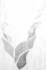
▲デザイン「Red data animal」