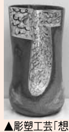
▲彫塑工芸「想い出がいっぱい」