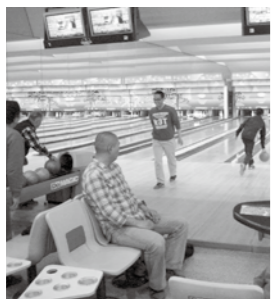
▲年齢に関係なく大勢で楽しめるボウリング大会

健康体力センター講習会(1月) □とき=17日(木)・31日(木)午後7時、10日(金)・24日(木)午前10時(託児付) □ところ=まきがね公園体育館健康体力センター □料金=520円 □持ち物=屋内用シューズ □対象=高校生以上(要予約・時間厳守) 託児付きトレーニングDAY(1月) □とき=10日(木)・24日(木)午前10時〜正午(要予約) □ところ=まきがね公園体育館健康体力センター プチ講習(1月) □とき=11日(金)(ストレッチ体操)、18日(金)(ソフトエアロビクス)、25日(金)(バランスボール)、午前10時〜10時半 □ところ=まきがね公園体育館 □料金=200円/回 社会体育施設の貸し出し(2・3月) □とき=1月22日(火)(2月分)、2月20日(水)(3月分)、午後7時 □ところ=まきがね公園体育館 甲・問 まきがね公園体育館(市体育連盟) ☎25-6478 (月曜日休館)