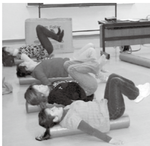
▲ボールを使ったストレッチの実技