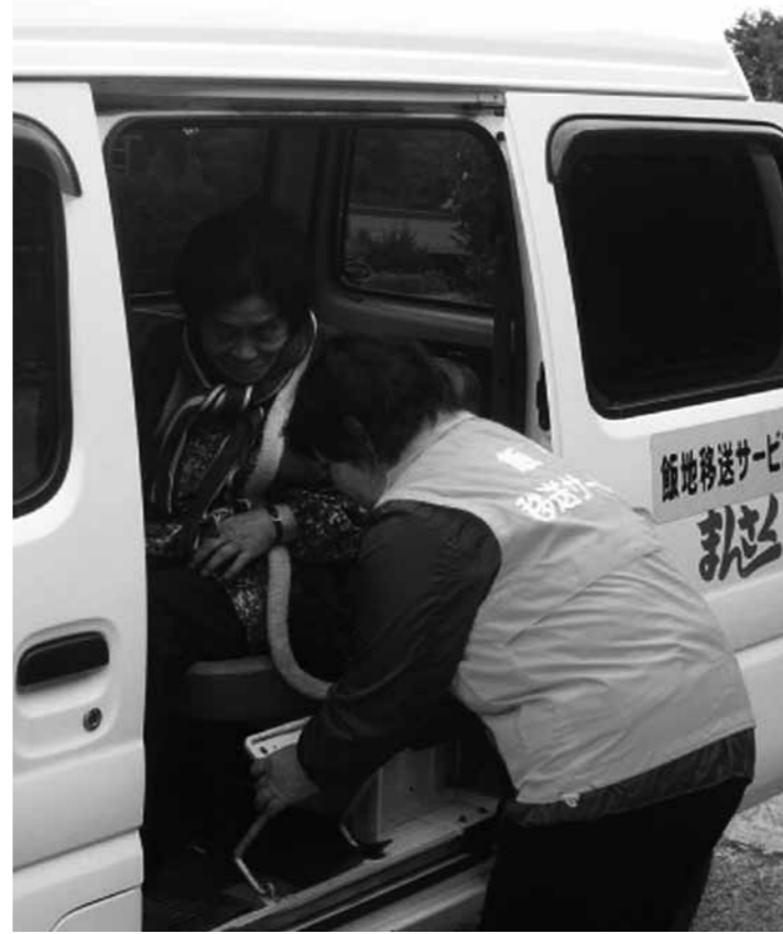
▲地域のボランティアが支える移送サービス

現代では、少子高齢化や核家族化が進行し、社会環境の変化や個人の生活様式の多様化で、地域内での交流や互いを思いやる気持が薄くなるなど、地域環境が変化してきています。そのため、地域生活では、個人や団体、ボランティアやNPOなどの活動が必要となっています。「地域福祉計画」は、地域住民や自治会、ボランティアなどの団体と行政が相互に連携して、個々に抱える問題や地域の課題を明らかにし、それに対する解決策の考案や地区ごとの方向性などを定めるものです。 ここでは、来年度から平成29年度までの「地域福祉計画」の内容(案)をお知らせし、皆さんからの意見を募集します。