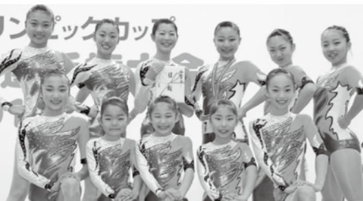
▲チーム部門で優勝した「FLAT BACK Jr. & Kids」の皆さん