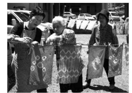
▲生活学校で染め物を体験

市内の交通事故(2月) 人身事故 16件(25件) 物損事故 137件(306件) 負傷者 17人(31人) 死者 0人(0人) ( )内は1月からの累計 救急車出動回数(2月) 147回(384回) ( )内は1月からの累計