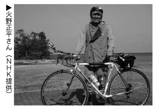
▶火野正平さん

生活の中で身近な課題を 取り上げて一緒に勉強しませ んか。 生活学校は、女性の団体で、 暮らしよい社会にするための 活動です。生活者の視点を生 かし、安全で安心して暮らせ る地域づくり、健康と食生活 の改善、子育て支援、環境問 題の推進など地域社会の身近 な問題や課題を、行政や企業 と話し合い解決を目指してい ます。 □ところ 中コミセン(内容 によって変わる場合あり) □定例会 毎月第2火曜日午 前9時半～11時半 □昨年の活動 廃油せっけん 作り、施設見学(市内の工場 見学)、市政への関心(市議 会の傍聴)、恵那の歴史を巡 る、焼肉のたれ作りなど □料金 1000円/年 申・問 社会教育課 ☎ 43- 2112(内線342)