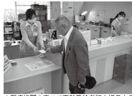
▲医療機関の窓口で高齢受給者証を提示する

国民健康保険では、平成25年4月からの制度改正が凍結され、対象の方は、当分の間、医療機関などにかかるときの自己負担が現在の1割に据え置かれます。 新しい高齢受給者証を、3月末までに送付します。4月以降に医療機関などにかかるときは、新しい高齢受給者証を提示してください。 【対象】 70歳〜74歳の現役並み所得者（3割負担）以外の方