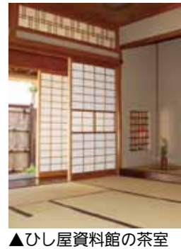
▲ひし屋資料館の茶室