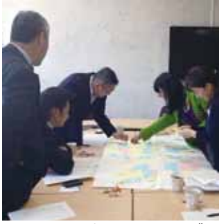
▲リニアを生かしたまちづくりについて検討する市民委員

リニア中央新幹線の整合的な評価を行う「超電導磁気浮上式鉄道実用技術評価委員会」を国土交通省が設置し、営業に必要な技術基準や騒音を含む沿線環境の課題などを議論しています。こうした機関から示される情報を分かりやすく紹介していきます。 市では、平成24年6月にリニアを生かしたまちづくり構想を策定する「リニアまちづくり構想市民委員会」を設置しました。全国の成功例や失敗例とされる先進的な事例を研究し、同じ過ちを繰り返さないよう市民委員会を中心に将来のまちづくりを検討しています。 いただいた意見は、市民委員会へ報告すると同時に行政内部でも認識し、今後の市政に生かせるよう努めます。 (リニアまちづくり課)