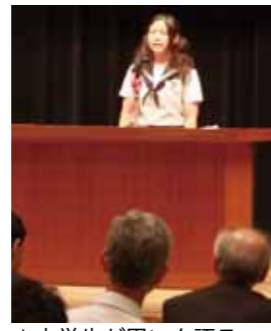
▲中学生が思いを語る

テーマは「社会や世界に向けての意見、未来への希望や提案」などの四つに、特別テーマ「ふるさと」の先人に学んだ