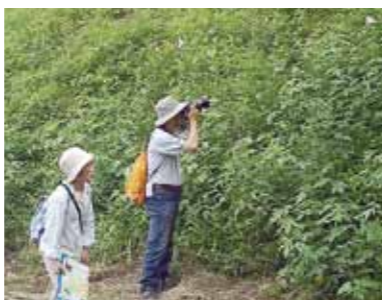
▲ササユリを見つけて記念撮影

イワクラ公園を出発し、見ごろを迎えるササユリを観賞しながら、点在する史跡を巡るウォーキングをします。 □とき 6月30日(日) 受付け 11時~9時 出発