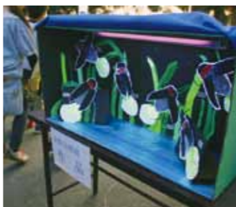
▲祭りを盛り上げる作品

蛍の育つ環境を喜び、世代を超えた交流を深める蛍鑑賞の夕べを開催します。 □とき 6月29日(土)午後7時 □ところ 宗久寺駐車場(定蓮寺川) ※雨天の場合は東野コミセンで開催します