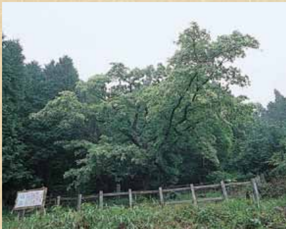
標高が高いため花の見ごろは6月中旬

東濃地方では、田植えが始まると、遠くから見ると雪を被ったように美しい木があちこちに見られるようになる。これがヒトツバタゴ。モクセイ科の落葉高木で、日本では対馬と愛知県、県内の木曾川周辺の限られた地域にしか自生していない珍しい木で、ナンジャモンジャなどと呼ばれて親しまれている。