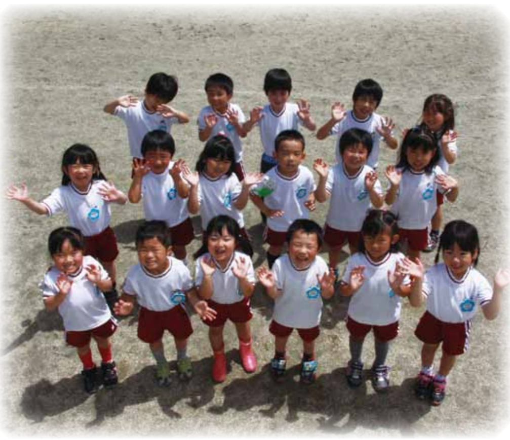
▲子どもたちの未来を考えた市の経営を実現 (写真は大井幼稚園5歳児)